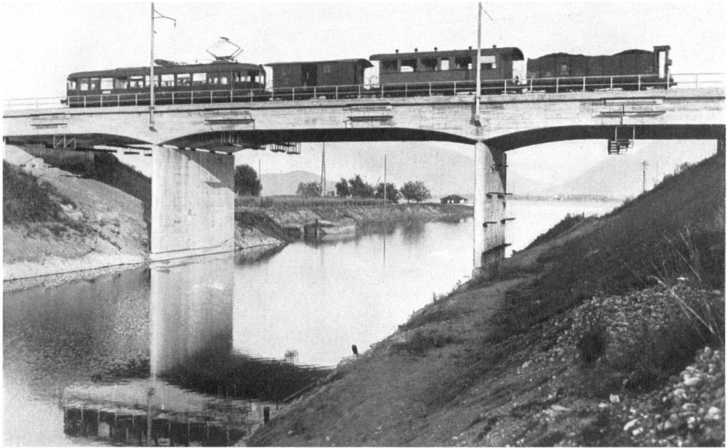
Das unlängst aufgetane „Tor des Fortschrittes“: unter der höher gelegten Bahnbrücke auf dem Rapperswiler Damm können nun die Dampfschiffe in den Obersee einfahren.

Une porte du Progrès! Trouvant la digue du Haut-lac, le chenal donne accès aux vapeurs zuricois.