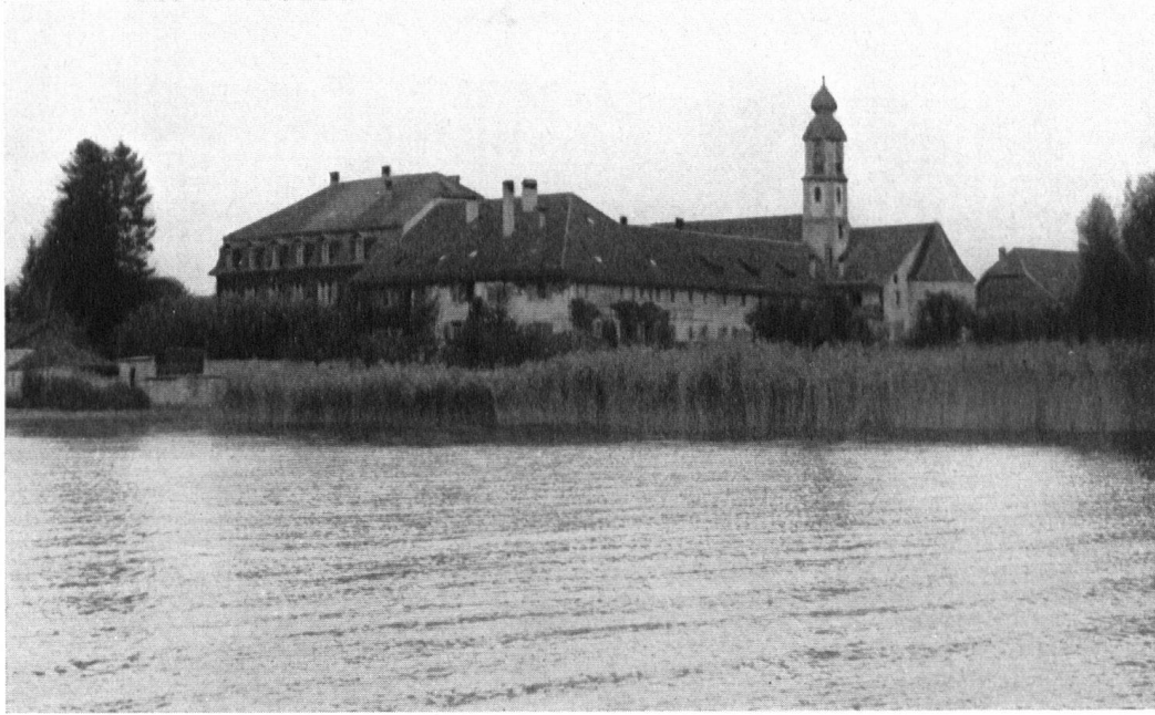
Das alte Frauenkloster Wurmsbach zwischen Bollingen und Bußkirch, das in seiner ländlichen Ruhe erhalten bleiben sollte. Siehe Plan Seite 104.

Le vénérable monastère de Wurmsbach. Le canon viendra-t-il en troubler la sérénité séculaire?