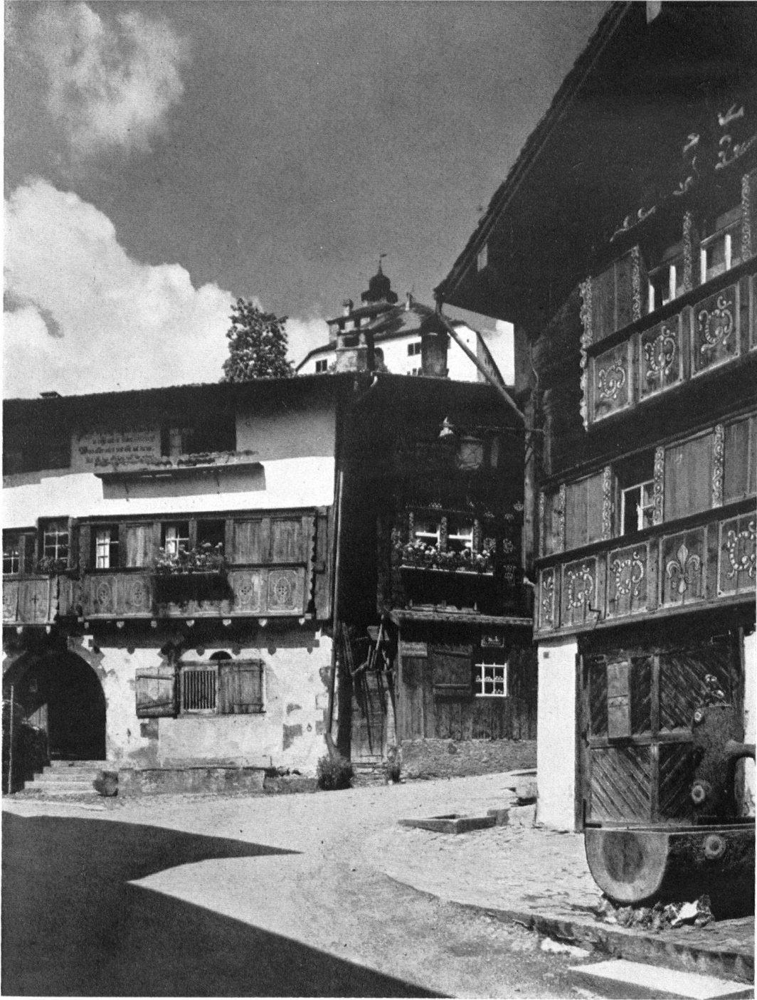
Werdenberg. Marktplatz mit dem sog. Montaschinerhaus, darüber das Schloß. Vor dem alten Hilty-Haus (rechts) ein Musterbeispiel des mißverstandenen Heimatschutzes: ein imitierter «Holzbrunnen» aus Beton!

La place du marché à Werdenberg. Le « Montaschinerhaus » semble rappeler que la demeure appartient à l'antique famille romanche des Montatsch. A droite, la splendide maison Hilty.