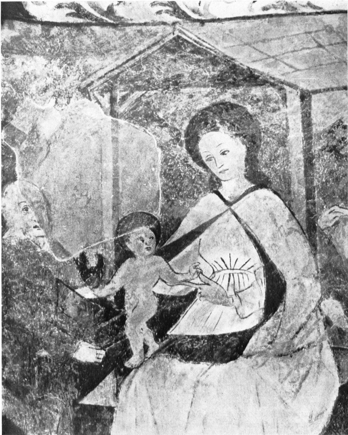
Muttergottes mit Kind aus der Anbetung. La Sainte Vierge et l'Enfant Jésus (fragment de l'Épiphanie).