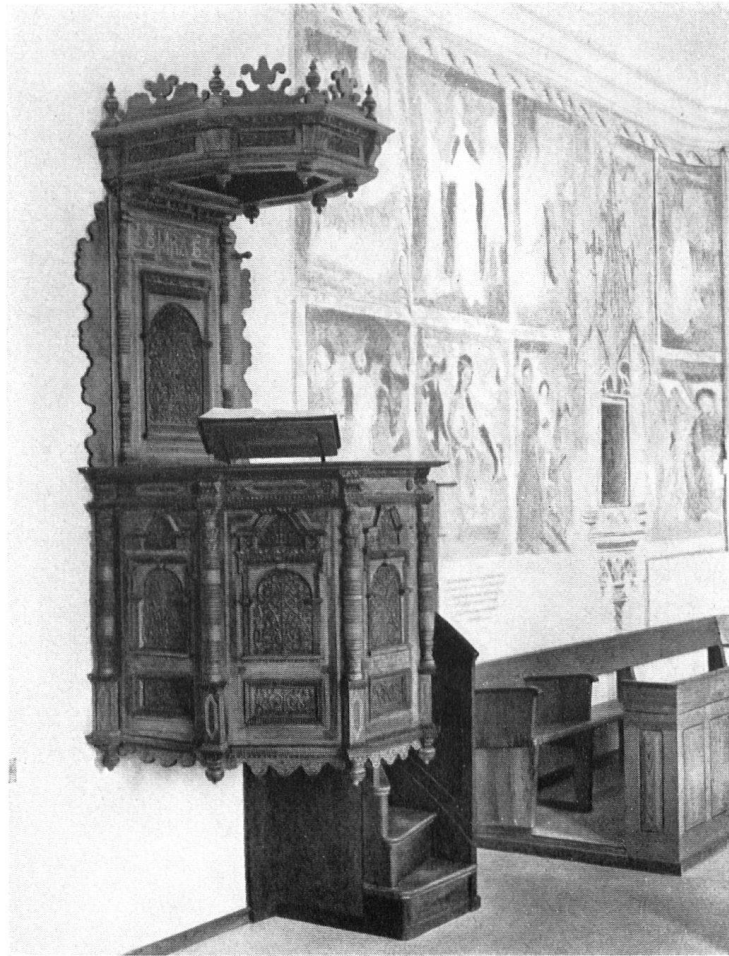
Kirche Ganterswil. Chor mit reichgearbeiteter Kanzel. Die Zierjahrzahl 1761 ist eher auf die Versetzung als auf die Erstellung der Kanzel zu beziehen.

Eglise de Ganterswil: la chaire sculptée.