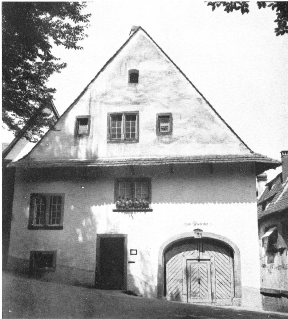
Der Pfefferhof im St. Albantal, Basel.

Le « Pfefferhof » (la maison du poivre), dans le quartier bâlois de St-Alban.