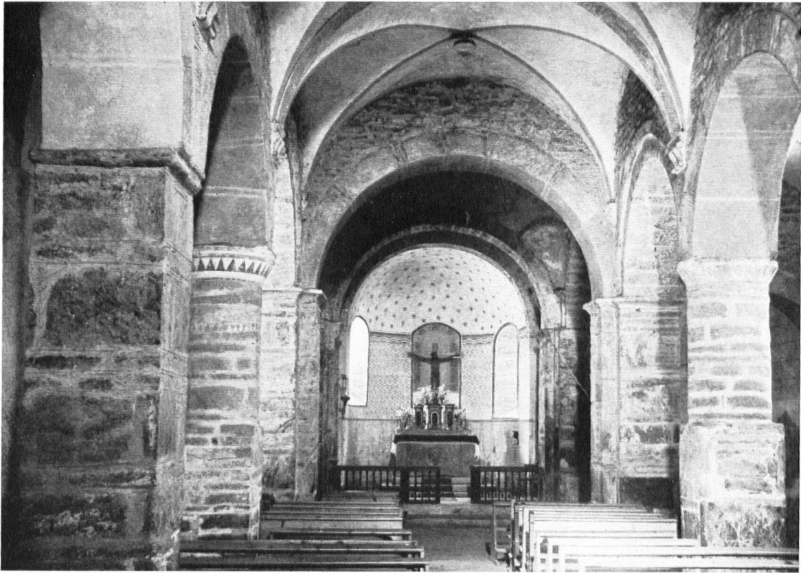
La nef de St-Pierre-de-Clages avant les travaux. St-Pierre-de-Clages. Das Innere der Kirche vor der Erneuerung. Come si presentava l'interno di St-Pierre-de-Clages prima dei lavori.

cire. Il fait bon s'arrêter un instant à l'ombre de ces murs presque millénaires, il fait bon, l'été, pénétrer dans la fraîcheur du sanctuaire. D'admirables surprises, d'ailleurs, nous y sont réservées.