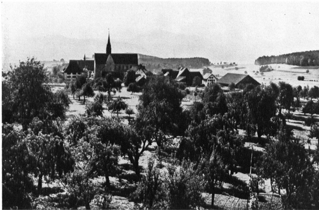
Blick vom Naefenhaus in Kappel am Albis gegen das ehemalige Kloster. Vue de l'ancien couvent de Kappel, sur l'Albis, prise du Naefenhaus.