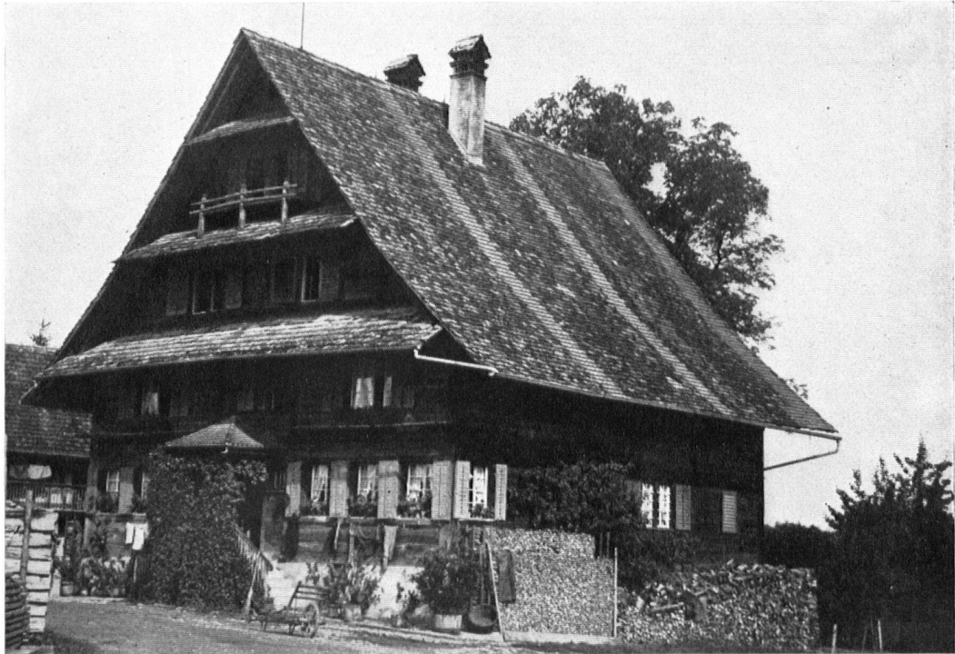
Ständerbau im Grüt bei Mettmenstetten (Kt. Zürich). Maison de madriers, à Grüt près Mettmenstetten (Zürich).

zenden Hände des Heimatschutzes vor Verschandelung zu retten. Auch auf Dorfstraßen und -bäche ist das Augenmerk gerichtet worden. Daß die bereits mit Hilfe des Heimatschutzes restaurierten Objekte Aufnahme fanden, ist selbstverständlich, und mit Stolz haben denn auch die Besitzer ihre in den Stuben aufgehängten »Urkunden« der Vereinigung gezeigt.