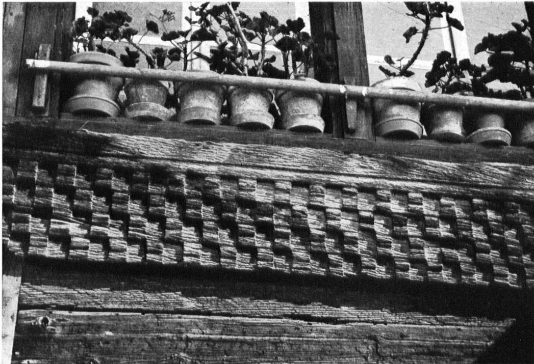
Schachbrettfries an einem Bauernhaus in Türlen. Frise denticulée sur une maison de Türlen.

überwiegen die ersteren, und es war oft rührend, wie die Leute in entgegenkommender Weise ihr Heim gezeigt und davon erzählt haben, obwohl sie oft mitten aus ihrer strengen Feldarbeit geholt wurden. Andere wiederum wollten die Sache nicht begreifen und führten mich nicht ohne eine gewisse Vorsicht im Hause umher, in der Meinung, ich käme von »irgendeinem Heftli« oder wolle eine Feuerversicherung abschließen. Diejenigen Besitzer, welche ihr Haus einer würdigen Restaurierung unterziehen möchten, wurden im Inventar aufgeführt.