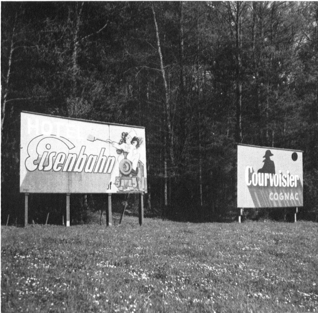
Ein dekoriertes Waldrand bei St. Erhard (Luzern).