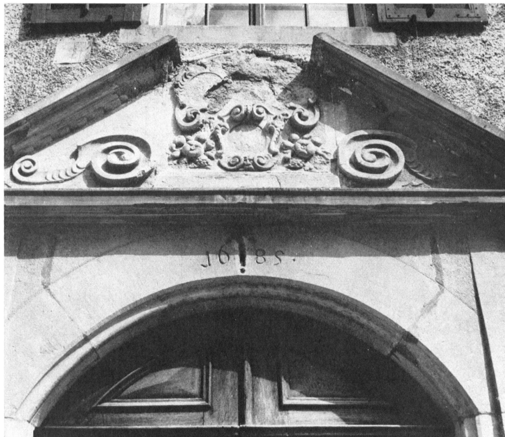
A Regensberg, dans le canton de Zurich, l'entrée du château est ornée d'un fronton que martelèrent jadis les révolutionnaires.