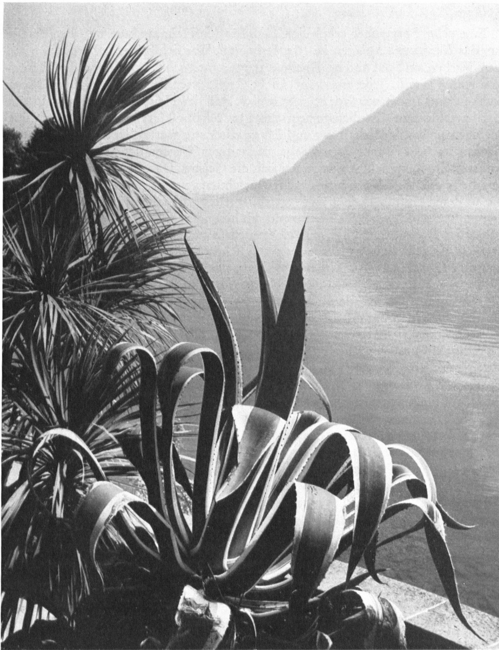
Ankauf der Inseln von Brissago gemeinsam mit dem Kanton Tessin und den Ufergemeinden. Um- wandlung in den Botani- schen Garten der Süd- schweiz. Beitrag: Fr. 100 000.- (1950).