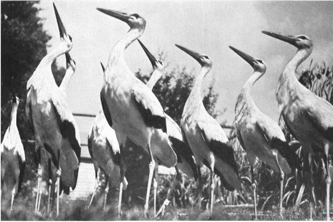
Ausbau der Vogelwarte Sempach, Förderung ihrer Bemühungen für Schutz und Hege der einheimischen Vogelwelt. Beitrag: Fr. 50 000.- (1953).