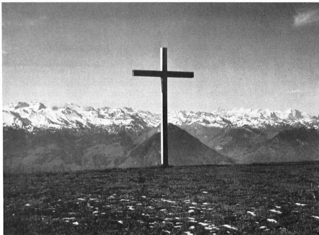
Derselbe Platz nach dem Abbruch der Regina Montium, aufgenommen vom mittleren Schwingplatz aus: das Hotel ist verschwunden, an seiner Stelle steht das Kreuz. An diesem Ort versammelt sich der Heimatschutz zur 50-Jahrfeier.

bringen, daß das Zeitgemäße, was heute gebaut wird, in hundert Jahren von unseren Urururenkeln wiederum unter Denkmalschutz gestellt werden wird. Fallen wir den echten schöpferischen Kräften unserer Tage nicht in den Arm!