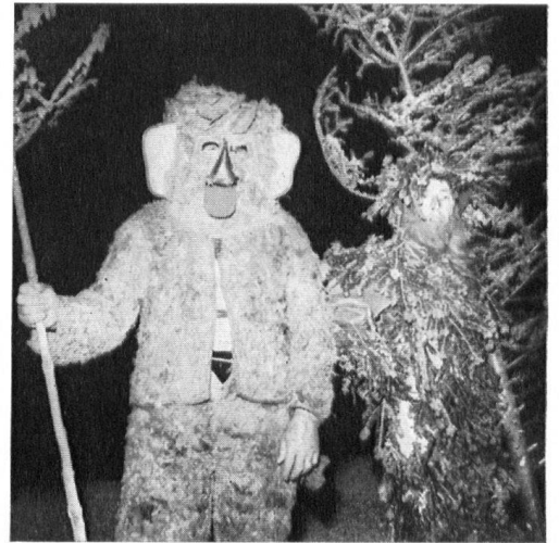
Wildmänner tauchen aus der Nacht auf und haben dem Landesobmann brennende Fackeln übergeben. Er legt das Feuer an den Holzstoß, und die letzten Überreste des Hotels Regina Montium gehen in Flammen auf.

Kulmhaus hinuntergezügelt, wo man ihnen vor Wind und Regen geschützte kleine Läden einbaut. Und wie angenehm es sich auf den sanftgezogenen neuen Wegen wandelt, wie schön der Blick über die neuen hölzernen Alpzäune hinunter in die Tiefe sich auftut!