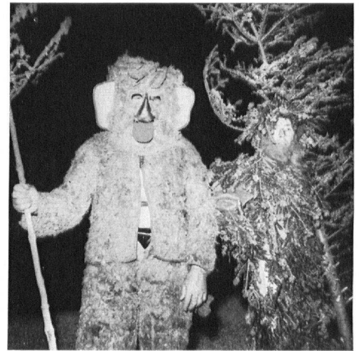
Des sauvages surgissent de la nuit, en brandissant des flambeaux qu'ils apportent au Président. A lui l'honneur de mettre le feu aux décombres du « Regina Montium ».

Sur les quais de Lucerne, cependant, la foule consternée allait répétant que là-haut, le nouvel hôtel du Righi était en train de brûler... En fait, ligueurs et ligueuses s'y rassemblaient gaîment, échangeant leurs impressions de la journée, écoutant les jodels et dansant au rire des clarinettes.