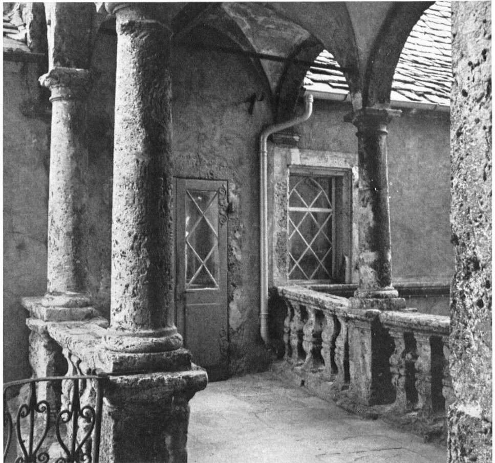
Une galerie à colonnes et balustrades relie l'ancien et le nouveau palais.