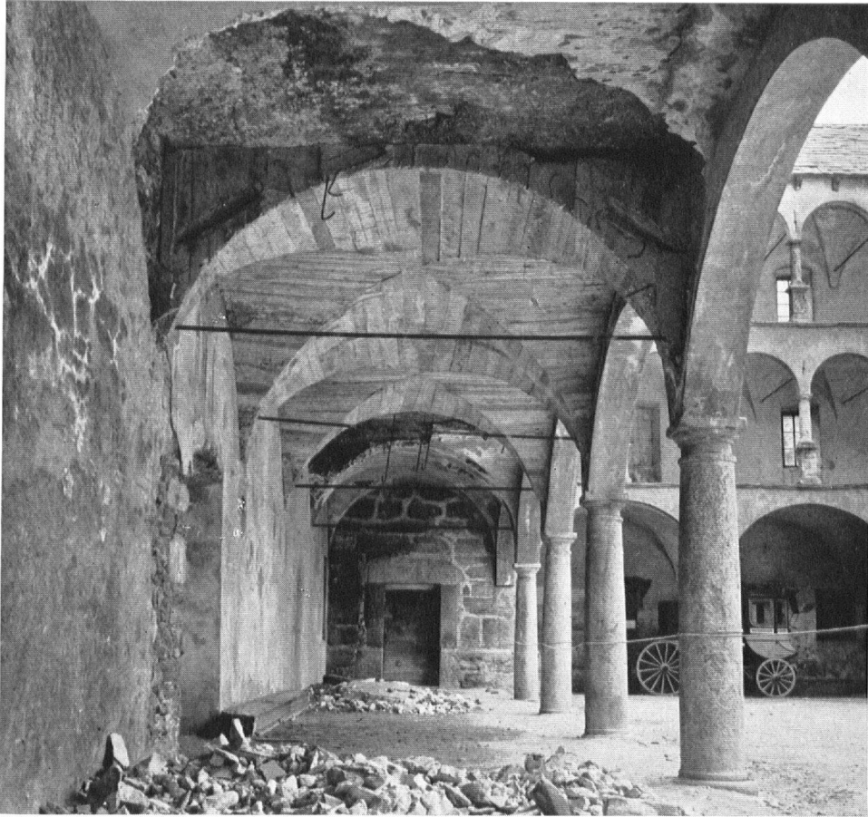
Dans la cour d'honneur, des voûtes s'effondrent (été 1955). Il est urgent de porter secours à l'édifice qui menace ruine.