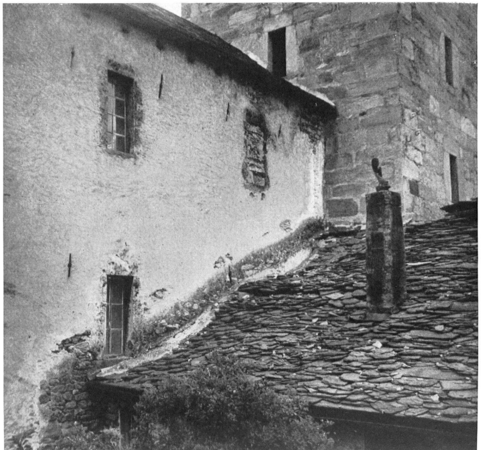
La toiture couverte de schiste valaisan s'affaisse lentement...