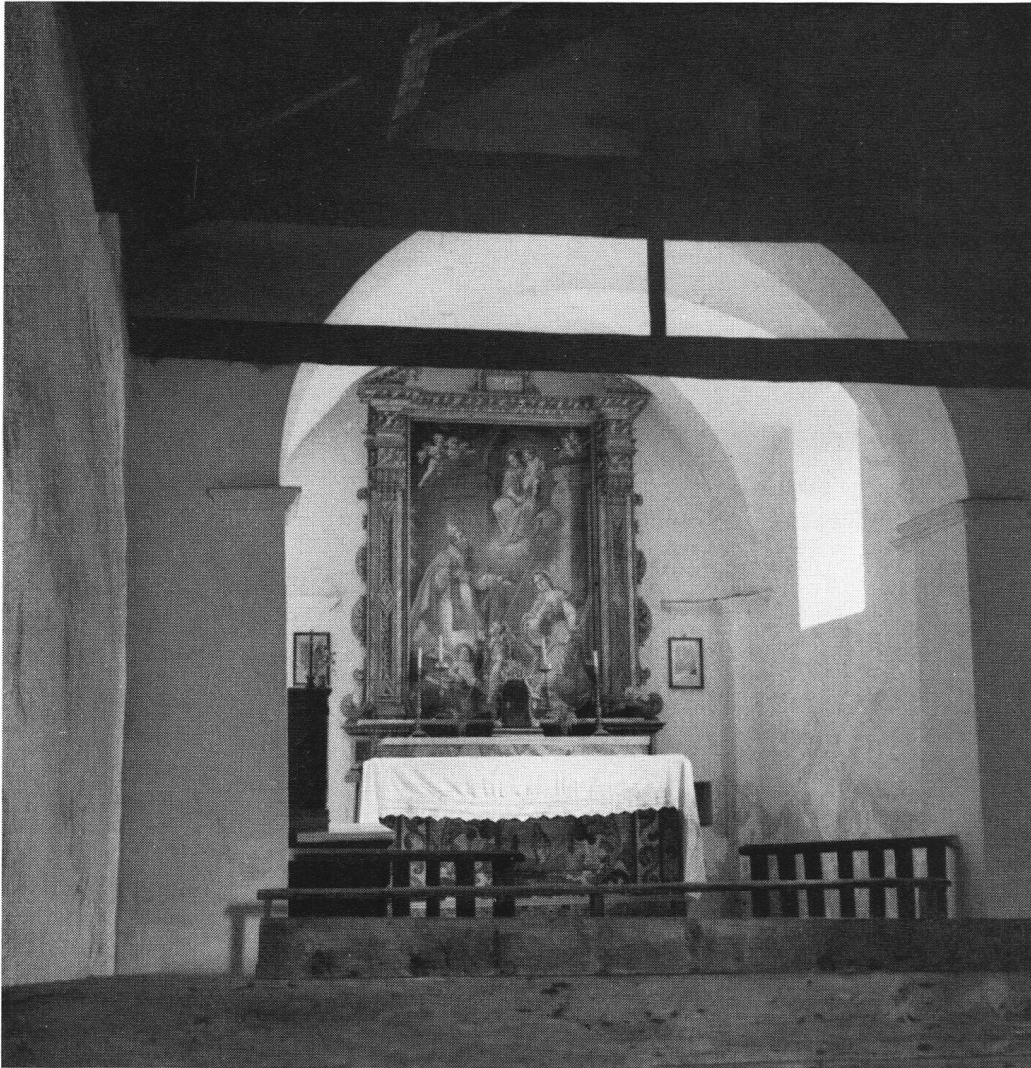
Das Innere des erneuerten Kirchleins.

fast vollständig aus dem Felsen gehauen ist, und dort, wo die neunstufige Felsentreppe auf den Boden tritt, öffnet sich eine Spalte im Gestein, die einst begehbar war und zum ‚Ospizio‘ der Brüder hinüberführte, welche in dieser Einsamkeit vor mindestens achthundert Jahren ihre Klause errichtet hatten, fern der lauten Welt, dem Himmel nah.