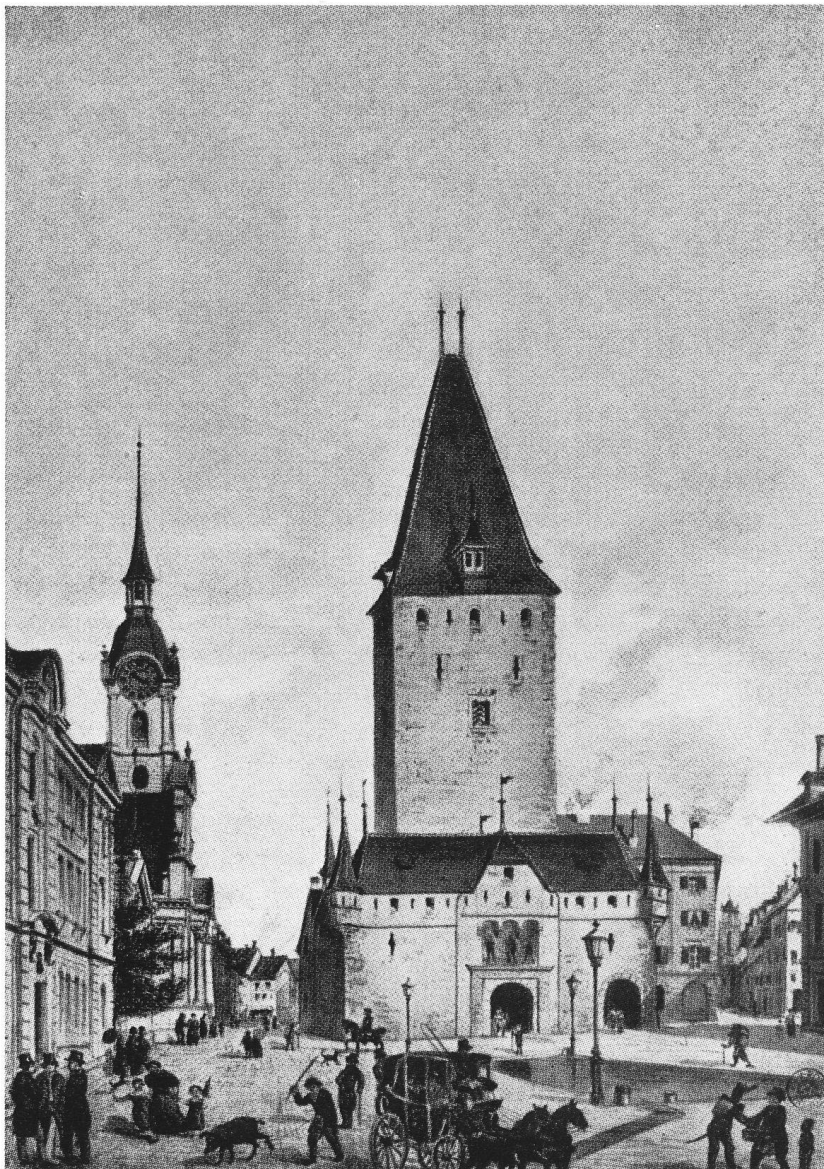
Autre exemple de barbarie, unanimement déploré aujourd'hui, qui peut servir d'avertissement: en 1864, les Bernois décidèrent à quatre voix de majorité de raser la tour Saint-Christophe, au moment de la construction de la gare. A gauche, la façade de l'hôpital des Bourgeois et le clocher de l'église du Saint-Esprit.

siècle à Berne, au sujet de la tour Saint-Christophe, à l'entrée de la vieille ville. Le combat dura quelque dix ans, passionné, et se termina en décembre 1864 par la victoire des « progressistes », à... 4 voix de majorité. Cette décision est jugée barbare aujourd'hui par tous les Bernois, qui en éprouvent encore remords et honte. En 1937, M. Markwalder, chancelier communal et archiviste de la ville, publia une brochure sur l'affaire de la tour St-Christophe; elle peut être produite utilement chaque fois qu'en Suisse se pose un problème de cette nature; elle y apporte toutes les lumières désirables et prend valeur d'avertissement.