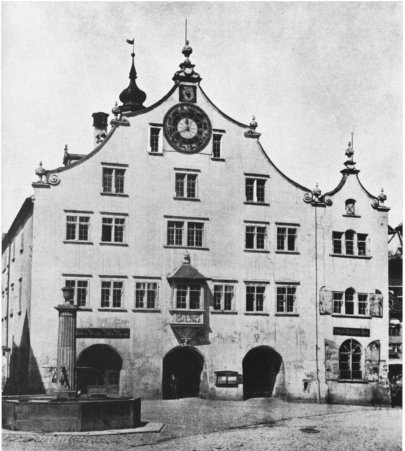
L'ancien Hôtel de Ville de St-Gall, qui fut sacrifié au trafic en 1877, revit sur ce document rarissime des débuts de la photographie.