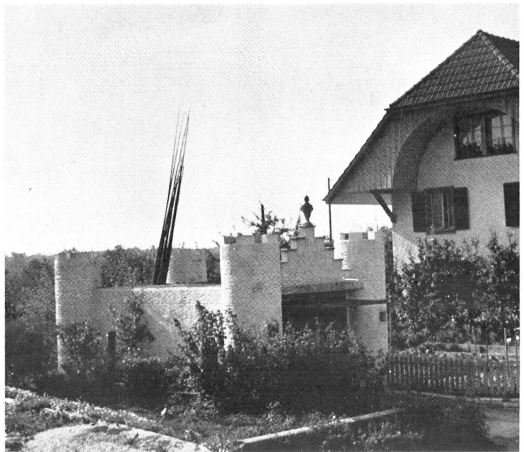
En terre bernoise, castel en miniature pour loger une auto.