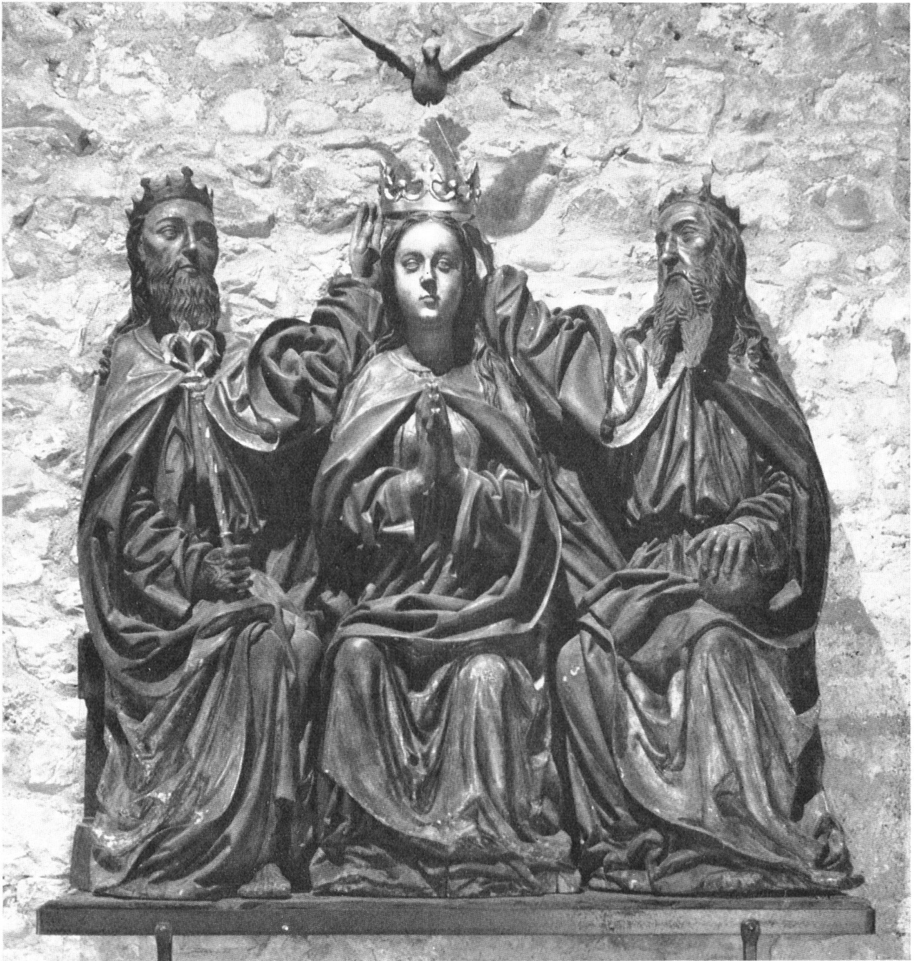
Nahaufnahmen der zwei Kostbarkeiten in der erneuerten Marien-Kapelle (s. Seite 25): Hier die spätgotische Marienkrönung, einstmals im Schrein des Hochaltars der St.-Martins-Kirche in Hochdorf.

Evangelisten und ihren Symbolen und gar das Mittelstück, die Kreuzigung, können vor allem für den Kunstfreund ein Erlebnis werden, weil er diese Einzelheiten ganz aus der Nähe betrachten kann.