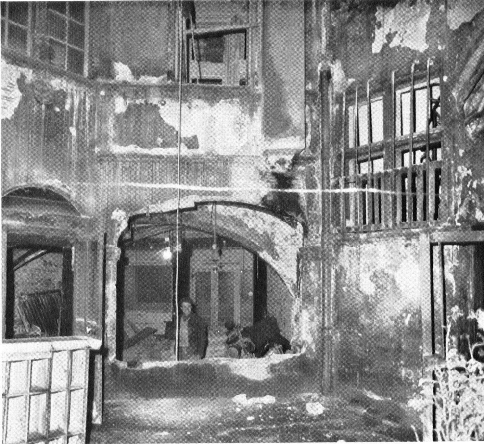
Der Hof eines Hauses des alten Lyon, im Zustand, wie er sich 1965, bei Beginn der Restaurierung, präsentierte.