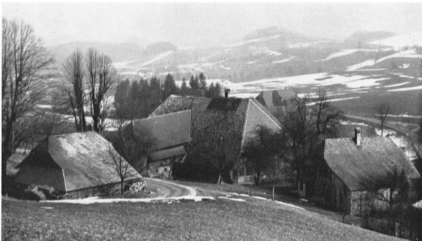
Diese Bauernhausgruppe in der Gemeinde Dürrenroth

im Emmental ist eines von unzähligen Beispielen, wie die alten Hofgruppen sich organisch und zwanglos in die Landschaft einfügen. Wegleitend waren die natürlichen Gegebenheiten. Die