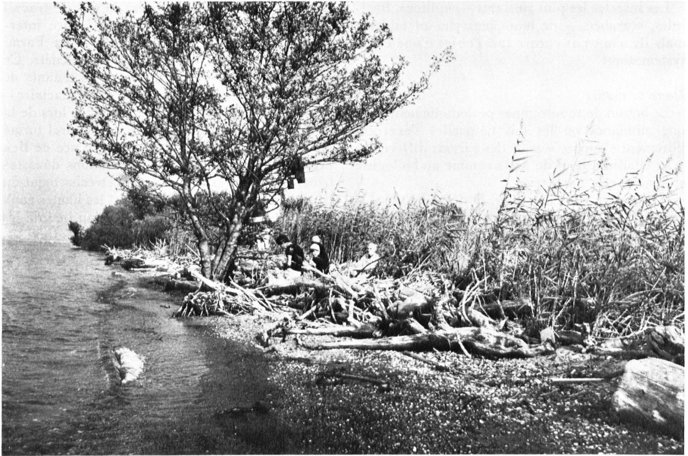
Les dragages dans le lac et la régulation des eaux ont provoqué une forte érosion. Le courant défavorable a pour conséquence, le long de la rive, un remblai artificiel qui interdit l'accès de la roselière aux grèbes et aux foulques.

approcher d'assez près. Au nombre de ces voyageurs, il y a aussi quelques rapaces (pygargue ou aigle de mer, faucon kobez), beaucoup de charmants passereaux (pouillots, gorge-bleues, traquets, etc.) et des laridés, dont tous – la guifette noire par exemple – ne sont pas de vulgaires mouettes. Parfois le spécialiste repère une rareté: ibis falcinelle, tadorne de Belon, phalarope à bec large, bruant des neiges.