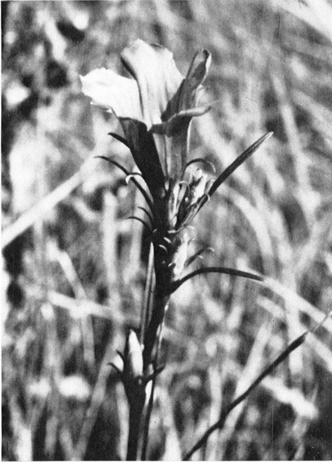
La forte diversité de structure du sol, dans les différentes parties de la basse plaine du Rhône, explique qu'une végétation exceptionnellement riche s'y soit acclimatée. A côté des plantes spectaculaires comme les roseaux, massettes,