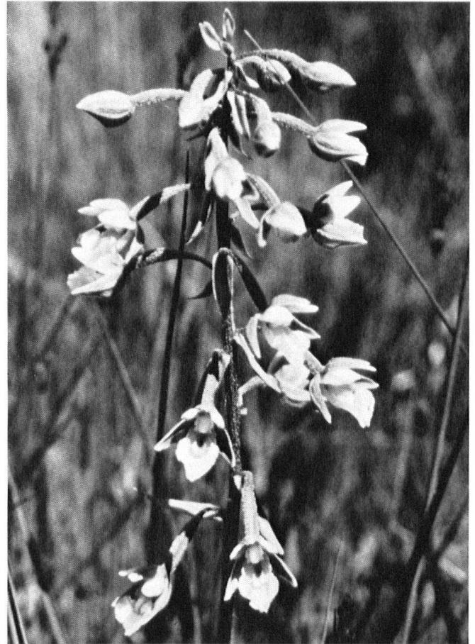
marécageuses. Le trèfle d'eau (à gauche) et l'orchis des marais (à droite) nous émerveillent par la beauté de leurs fleurs. Bien que la cueillette et l'arrachage de ces plantes soient strictement interdits et punissables, leurs effectifs