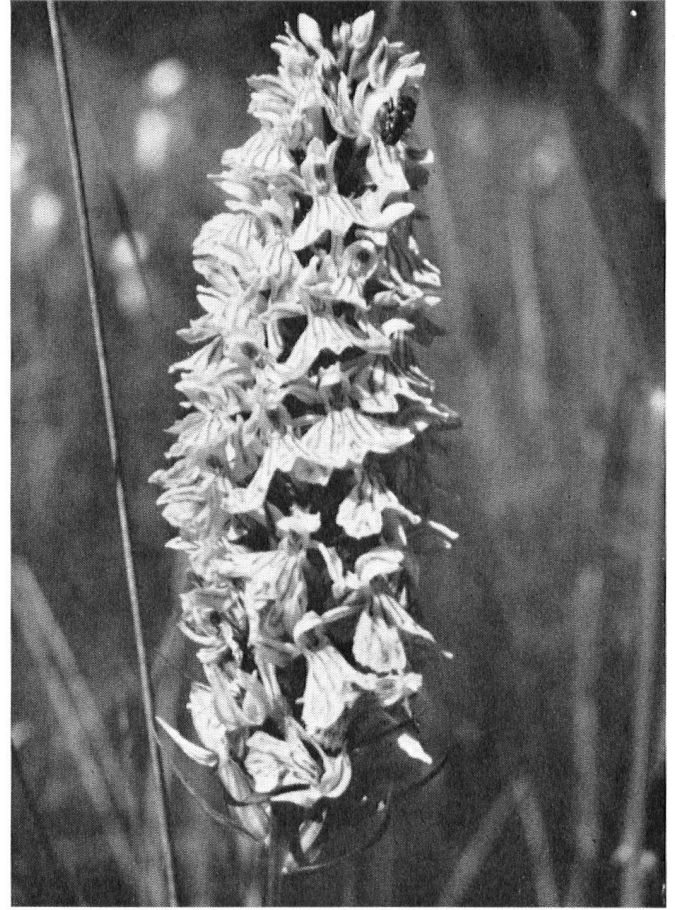
buissons et arbres de diverses espèces, il en existe de plus modestes méritant néanmoins notre protection. La gentiane pneumonanthe (à gauche) est une rareté dans notre pays; comme l'orchis tacheté (à droite), elle croît dans les prairies

ordres. En empêchant l'alluvionnement, il bouleverse une zone où d'innombrables oiseaux cherchaient leur pitance. Le travail de la drague accélère, d'autre part, l'érosion destructrice de la rive où les massifs de roseaux abritent toute une avifaune.