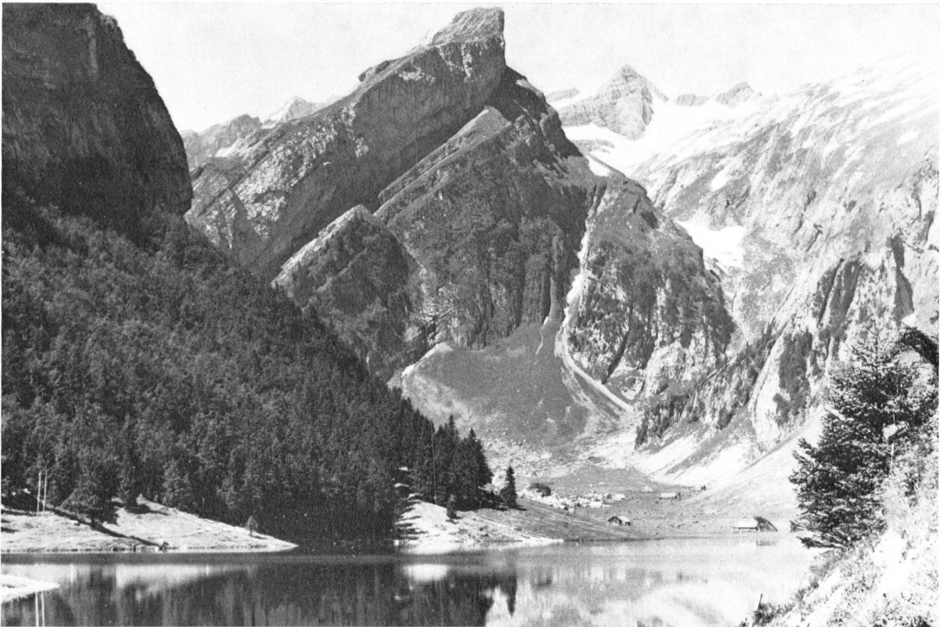
Das bisher sozusagen unberührte Hochtal des Seealpsees gehört zu den schützenswerten Landschaften von nationaler Bedeutung. Übertagt wird es vom markanten Felsabsturz der Rossmad; im Bild rechts daneben der Gipfel des Säntis.

schohen, bis der ganze Problemkreis, und mit ihm die Frage der effektiven Möglichkeiten des Schutzes dieser Landschaft abgeklärt ist.