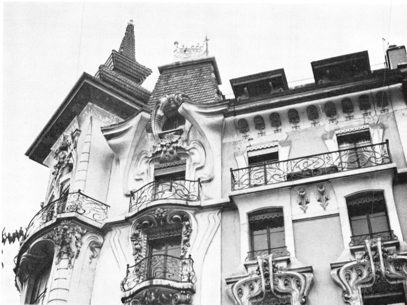
Das «Pfauenhaus» in Genf-Eaux-Vives, eines der wenigen unverfälschten Beispiele der Jugendstilarchitektur unseres Landes. Die Gestaltung der oberen Fassadenpartien; man beachte die reiche Dekoration der Balkonfenster-Einfassung halblinks.