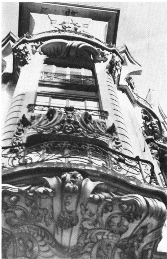
Belebt von üppiger ornamentaler Verzierung schwingen sich die beiden Ecktürmchen empor.