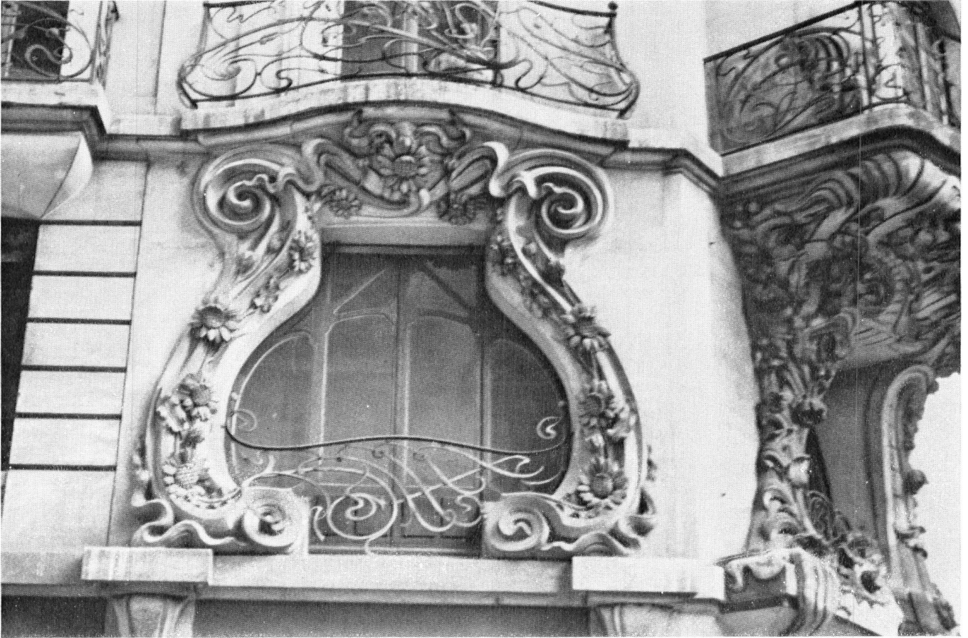
Detail einer der Fenstergestaltungen der «Maison des paons».

Intakt gebliebene Schaufensterfront; soweit sie nicht mehr vorhanden ist, soll im Erdgeschoss die Originalform der Schaufensterfassung wiederhergestellt werden.