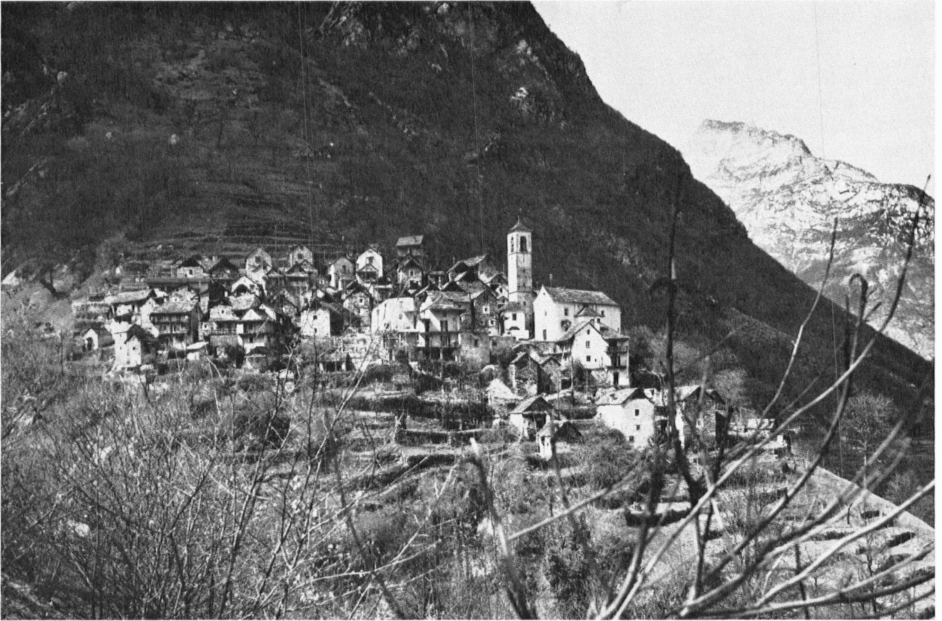
Corippo, dans le val Verzasca, l'un des villages tessinois les plus caractéristiques. Des études sont en cours pour assurer et son intégrité et sa survie.