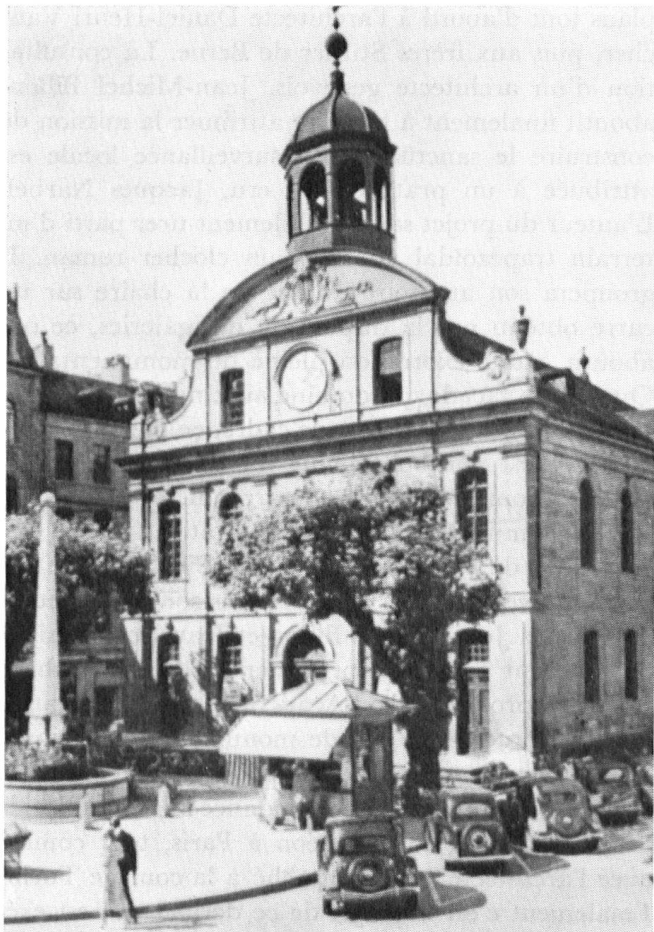
A Genève, le plus frappant exemple de l'architecture réformée française, est le Temple Neuf, appelé aujourd'hui église de la Fusterie, dont l'architecte est Jean Vennes (1715).

Neuchâtel – La première église protestante construite en Suisse romande sur le modèle des églises classiques réformées de France est le Temple du Bas à Neuchâtel (1695) sur les plans de J. Humbert-Droz.