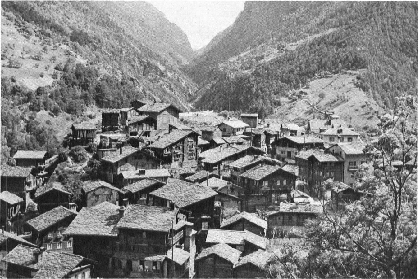
Valais. Village cohérent; réglé avant l'ère de la préfabrication des éléments—types des fenêtres, des toitures et des façades de bois.

Dans deux villages valaisans les curieux affluent pour contempler les jeux immodestes, puérils et inarticulés des entassements de béton des églises nouvelles où, par des concessions douteuses au pseudo-modernisme, les gardiens de la vie spirituelle croient pouvoir maintenir leur primauté.