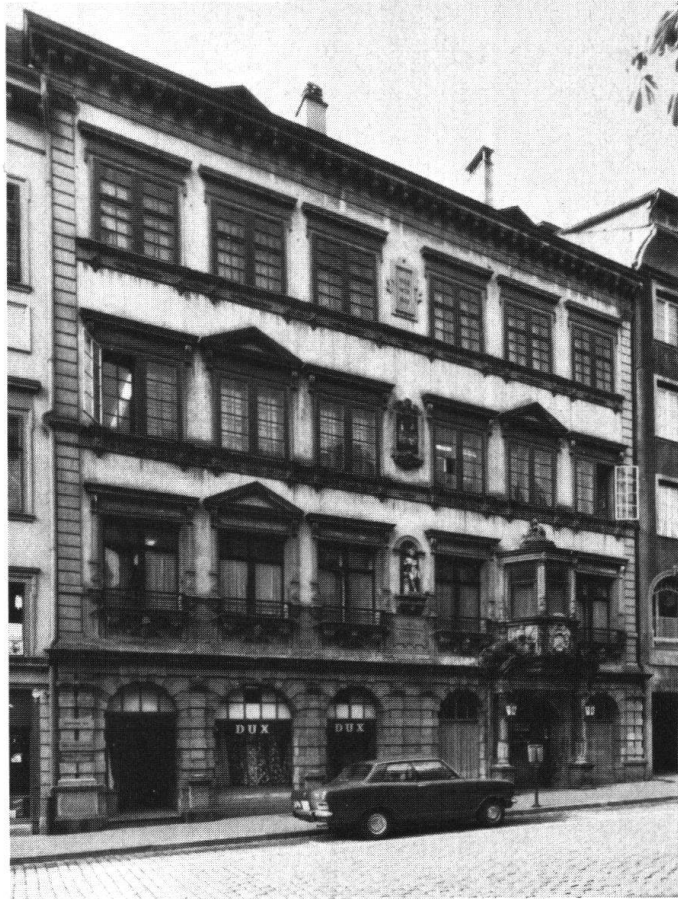
Schaffhausen. Haus «Zum Sittich»

reit, mit Unterstützung durch den Heimatschutz und die öffentliche Hand die Fassade fachgerecht renovieren zu lassen. Die berechtigte Frage, ob sie bei dieser Gelegenheit auf den Zustand vor 1870 zurückzuführen sei, wurde von allen Beteiligten verneint. Sie vertreten die Auffassung, dass die vor rund hundert Jahren vorgenommenen Veränderungen als Kulturdokument ebenso zu respektieren sind wie die älteren Bauteile, zumal die Neurenaissancezutaten als durchaus gekonnte Stilinterpretationen gewertet werden müssen.