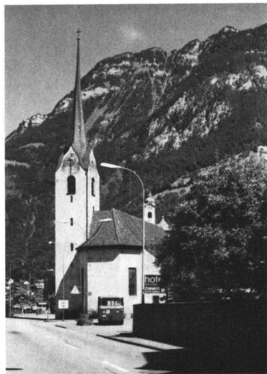
Seedorf. Pfarrkirche vor der Restaurierung (links). – Flüelen. Alte Pfarrkirche, profaniert und einer Wiederherstellung harrend