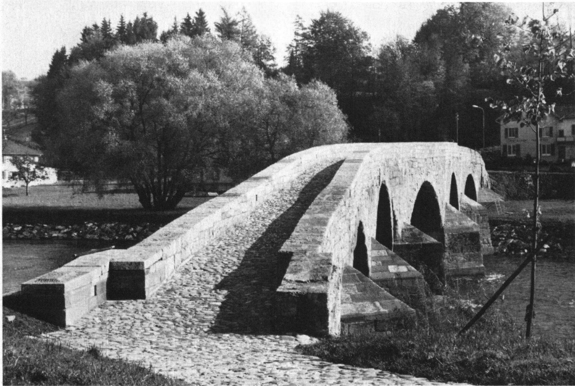
Bischofszell. Die mittelalterliche Thurbrücke (1478) nach der vollständigen Restaurierung.

Gleichzeitig wird jede Gemeinde ersucht, in ihrem Einflussbereich eine bestimmte Aufgabe anzupacken und zu lösen. Die Vorschläge reichen von einer Ausstellung der Stadtentwicklung gestern – heute – morgen, über den dringenden Rat, die Baulinien um die bestehenden Häuser (und nicht durch die Bauten) zu verlegen, bis zur Empfehlung, eine Brunnenanlage zu erstellen oder einen Baum zu pflanzen.