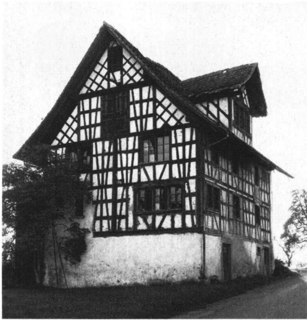
Schönenberg, Hinteregg, Bauernhaus Hitz (Ostansicht) nach der Restaurierung