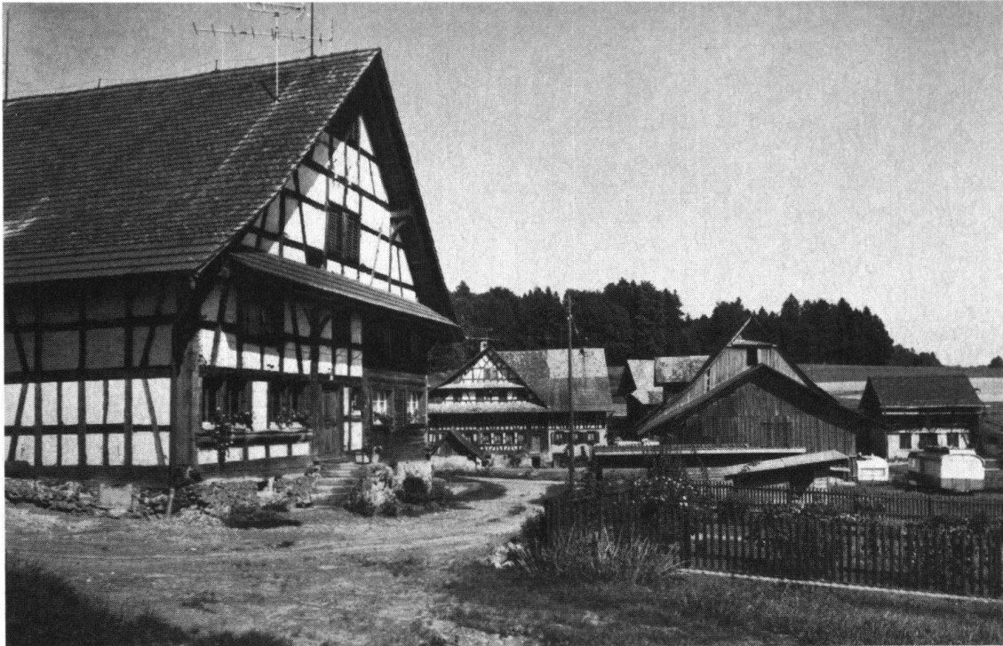
Mettmenstetten, Weissenbach. Hinten: Bauernwohnhaus, Mitte: ehemalige Mühle

Heimatkundeunterrichtes dienen. Ferner wird zusammen mit einer Lehrergruppe versucht, eine nach Einzelthemen gegliederte Sammlung von Dokumentationsblättern bereitzustellen, welche vom Lehrer z. B. in Arbeitsblätter umgearbeitet werden können.