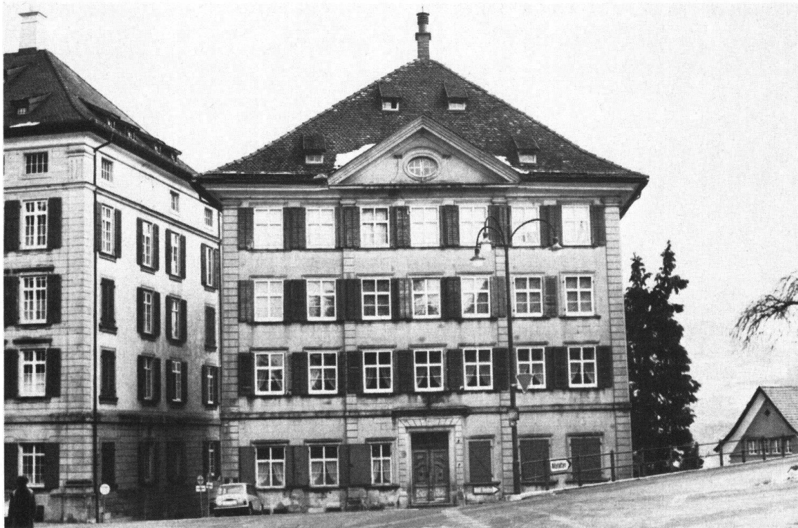
Trogen. Pfarr- und Gemeindehaus. Nordfassade

Die Restaurierung dieses bedeutenden Gebäudes als «Réalisation exemplaire» des Kantons wird dessen kunstgeschichtlich-kulturpolitischen Stellenwert gebührend ins öffentliche Bewusstsein heben.