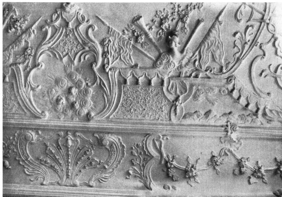
Sarnen. Herrenhaus im Grundacher. Régence-Stukkaturen im Festsaal

Dieses Haus ist für den Kunstdenkmälerbestand Obwaldens und die Lokalgeschichte von erstrangiger Bedeutung. Die einzigartige Baugruppe zeigt eine überaus gelungene, für Obwalden typische Verbindung von bäuerlicher und herrschaftlicher Bauweise , während die Ausstattung von der Lebensart einer repräsentativen Magistratenfamilie geprägt ist. Der Grundacher war während mehr als 250 Jahren Imfeld-Besitz. Um 1590 erbaute Landammann Marquard Imfeld dort ein einfaches hochgiebliges Holzhaus mit Speicher, das Landammann Just Ignaz Imfeld um 1740 zum schönsten Landsitz Obwaldens umgestaltet hat. Dem Altbau wurde an der Ostseite ein Treppenhaus vorgesetzt, der Speicher wurde zu einem eigentlichen Nebenhaus ausgebaut und beide Baukörper durch einen originellen Schwibbogengang verbunden. Schliesslich, und ganz unüblich für die einheimische Bauweise, wurde die ganze Baugruppe einheitlich unter Verputz gelegt. So entstand die eigenwillige «Zwillings»-Anlage, durch deren leicht verspielte Vornehmheit der alte bäuerliche Kern deutlich durchscheint.