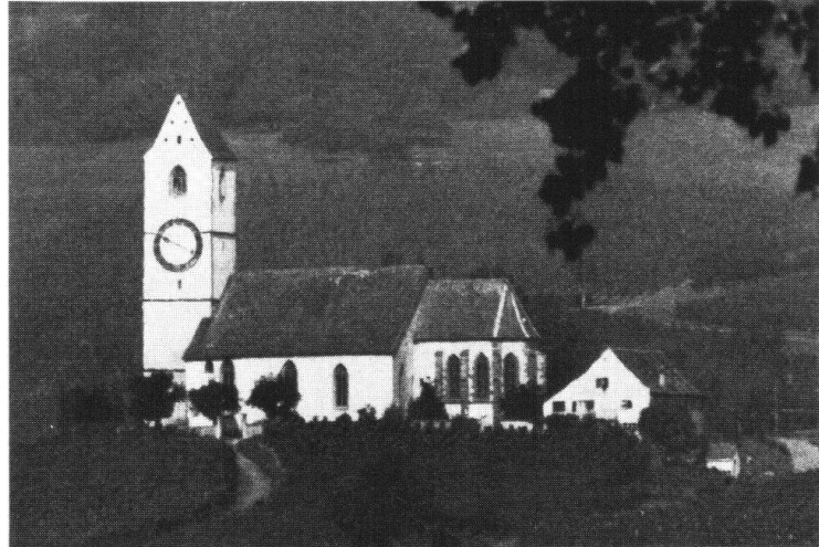
Hallau. Bergkirche St. Moritz

Der Gesamtzustand des Brunnens ist schlecht. Die aus Sandstein gefertigte Brun- nensäule und die Figur des Mohrenkönigs weisen die typischen Zerfallserscheinungen des Weichsandsteins auf. Bei der Säule besteht die Gefahr der weiteren Zerstörung wichtiger Einzelheiten, wodurch die Reproduktion stark erschwert würde. Obwohl die Trogwände aus dem dauerhafteren Kalkstein bestehen, sind sie zum Teil stark be- schädigt. Vor allem aber ist der untere Fries der Trogplatten durch das Anheben des Strassenbelages vollkommen verdeckt, wodurch die Proportionen verfälscht werden. Das Erneuerungsprogramm sieht deshalb vor, den Trog von Grund auf neu aufzuset- zen, wobei nach der Demontage festzustellen ist, welche Originalstücke wiederverwen- det werden können. Säule und Figur werden voraussichtlich in Hartsandstein kopiert. Die Frage, ob die Figur auf Grund der Farbspuren am Original bemalt werden soll, ist noch offen. Sollte sie bejaht werden, kommt für die Figur unter Umständen auch ein Kunststeinabguss in Frage.