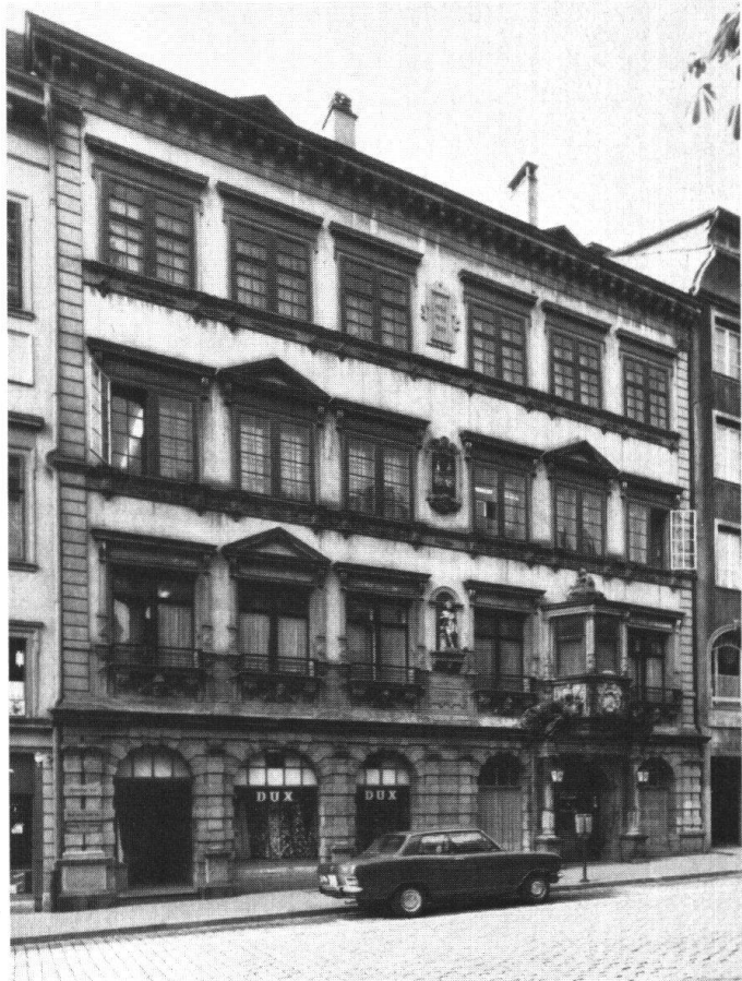
Schaffhausen. Haus «Zum Sittich»

reit, mit Unterstützung durch den Heimatschutz und die öffentliche Hand die Fassade fachgerecht renovieren zu lassen. Die berechtigte Frage, ob sie bei dieser Gelegenheit auf den Zustand vor 1870 zurückzuführen sei, wurde von allen Beteiligten verneint. Sie vertreten die Auffassung, dass die vor rund hundert Jahren vorgenommenen Veränderungen als Kulturdokument ebenso zu respektieren sind wie die älteren Bauteile, zumal die Neurenaissancezutaten als durchaus gekonnte Stilinterpretationen gewertet werden müssen.