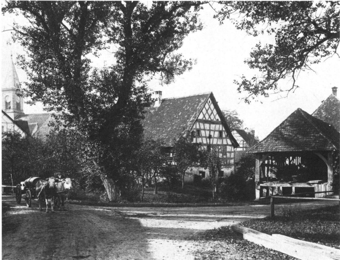
Buch. Dorfeingang mit Säge, vor 1910