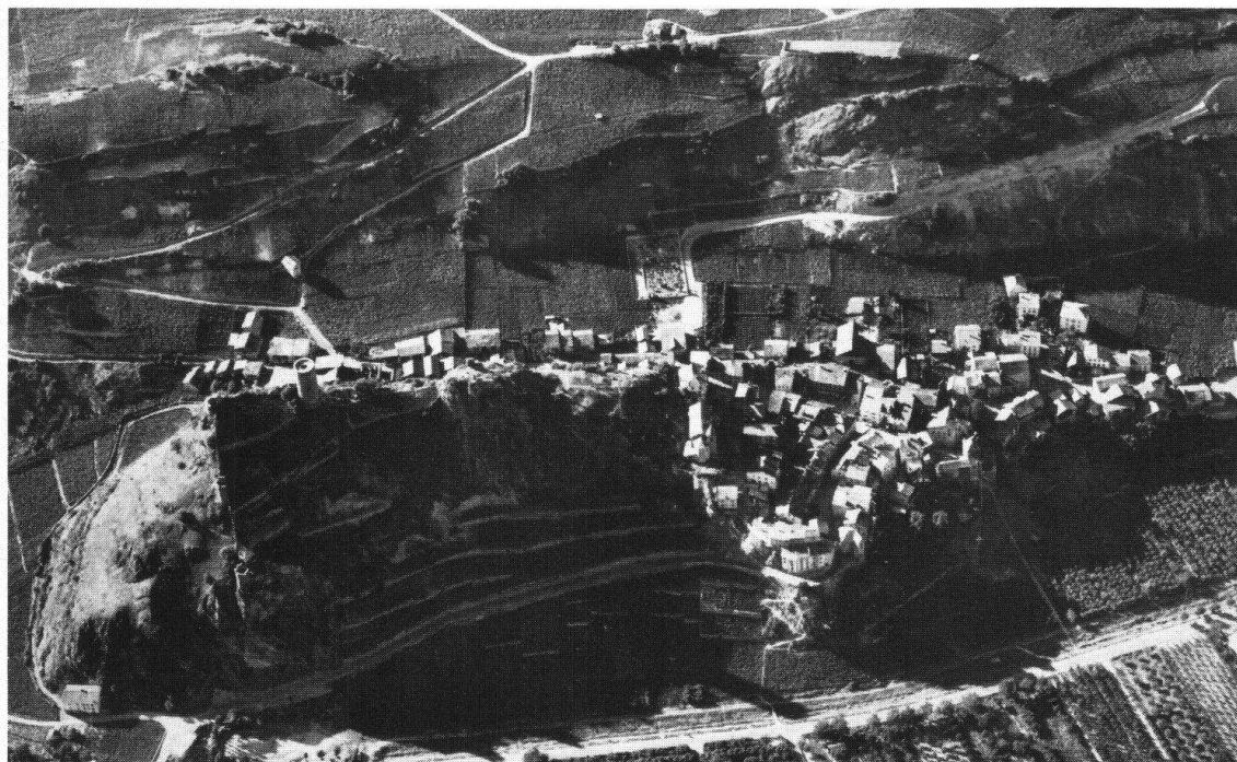
Saillon. Vue aérienne du bourg