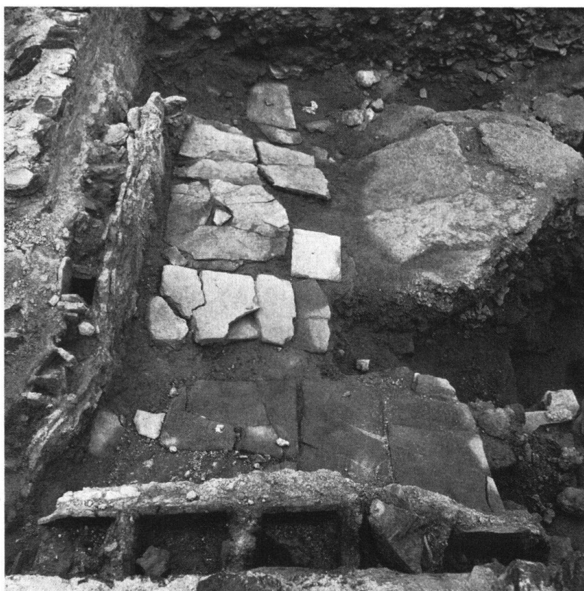
Martigny. Ville romaine Octodurus. Fouilles

Le programme relatif à Octodurus vise à éviter le massacre des vestiges antiques lors de constructions modernes, à mettre en valeur (sur place ou en musée) les plus belles trouvailles, à restaurer le « Vivier » (ruines de l'amphithéâtre), à recueillir le maximum de renseignements scientifiques et à intéresser le grand public. Ces buts doivent être atteints sans paralyser le développement de Martigny. Les rapports entre les besoins de la vie moderne et la sauvegarde des témoins d'un passé remarquable doivent être résolus ici de manière exemplaire.