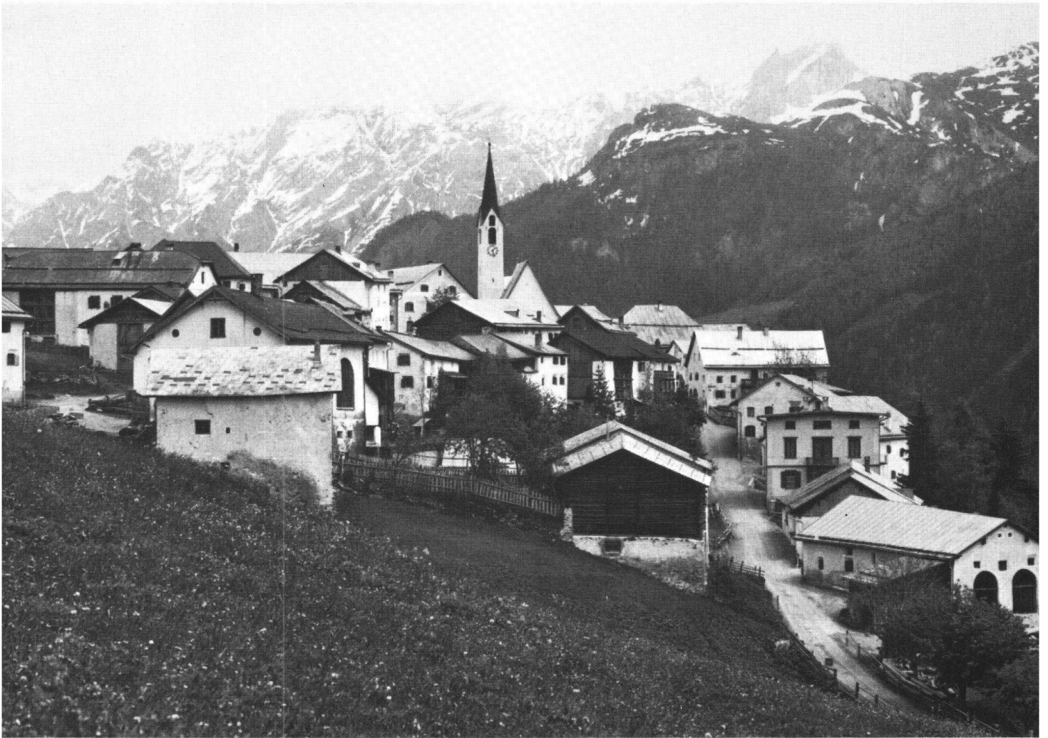
Le village de Guarda, en Basse-Engadine.

Guarda et la disposition et fonction de ses maisons en 1971. Tiré de Jürg Rohner: «Studien zum Wandel der Bevölkerung und Landwirtschaft im Unterengadin» (Basler Beiträge zur Geographie, 1972).