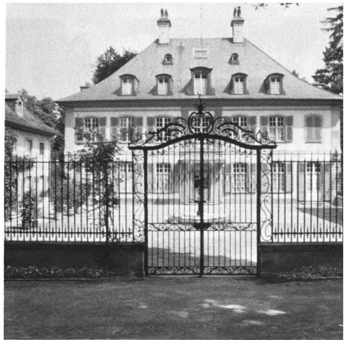
Der prächtige Park des in den 1770er Jahren erstellten Landsitzes «Ebenrain» bei Sissach (Baselland) wurde nach französischem Muster angelegt, später aber nach romantischem Empfinden umgestaltet.