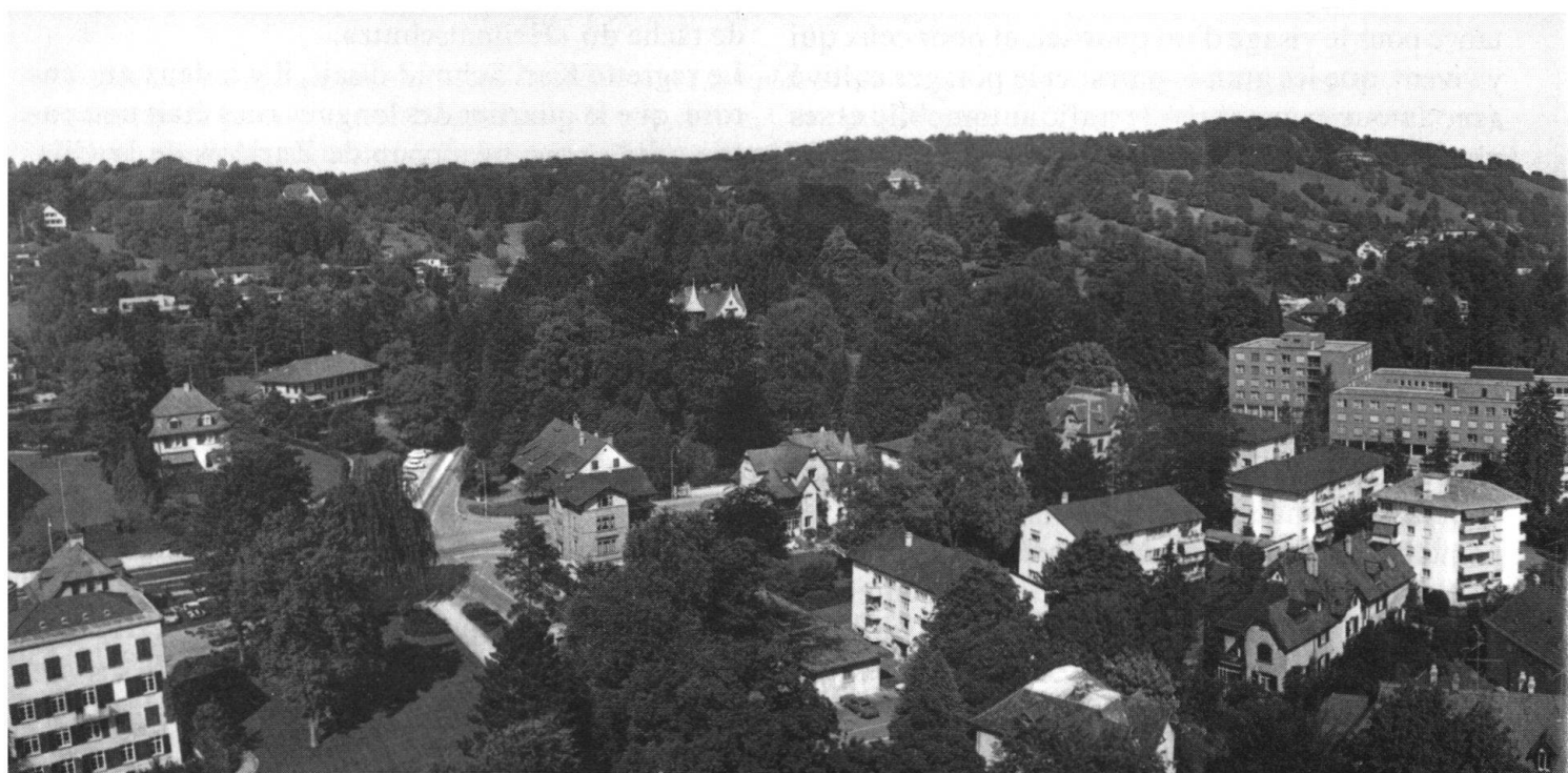
Dans le tableau de la ville industrielle de Winterthur, les arbres dominent.

Les cent dernières années ont considérablement modifié les conceptions humaines relatives à l'importance des arbres. Pour la première fois, des voix s'élèvent en faveur d'arbres beaux et vénérables. Pour les pionniers de cette protection, ce furent tout d'abord et surtout des considérations esthétiques qui entraient en jeu. Puis le brutal avènement de l'industrie, avec ses aspects les plus sombres, fut