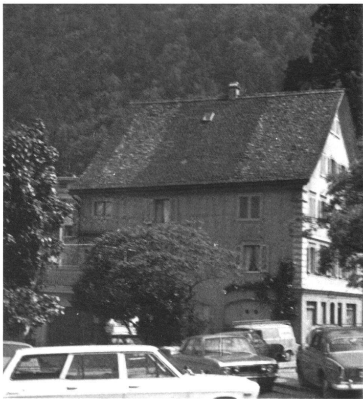
La «Lehnplatz» d'Altdorf; à l'arrière-plan, le groupe de séquoias illégalement abattu.

... Et pourtant nous vivons en un temps peu favorable aux arbres. Non seulement pour des raisons économiques (les forêts diminuent), mais aussi parce que notre temps est celui d'un extraordinaire gaspillage. Cela correspond à sa double tendance à la hâte et au nivellement: ce qui est élevé doit être abaissé, et l'âge perdre son prestige. L'arbre, par sa hauteur, est analogue au père, et avec lui tombent toutes les valeurs que symbolisait le père (Ernst Jünger).