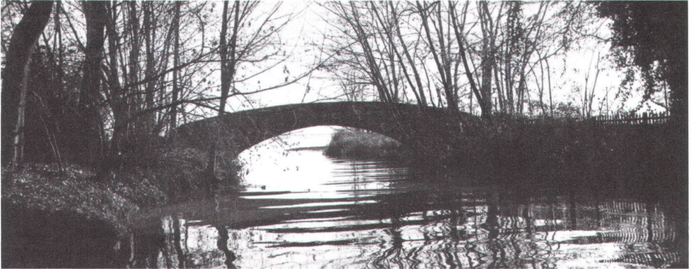
Auch solche Idyllen hätten dem Sportplatzprojekt weichen sollen.

Hochschulen bei Dorigny zurzeit über mehr als 150 Hektaren Land, von denen in Zukunft höchstens ein kleiner Teil bebaut werden dürfte.