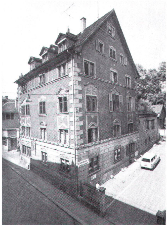
Bild unten: Intérieur einer Altstadtwohnung an der Augustinergasse. Bild oben: Eines der mittelalterlichen Stadelhofer Häuser, die durch Kauf im Jahre 1976 vor dem Untergang bewahrt werden konnten.

Präsident der Stadtzürcherischen Vereinigung für Heimatschutz