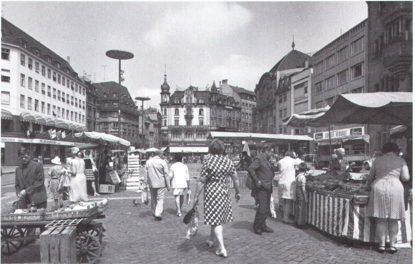
Bild oben: Der Basler Marktplatz gegen Norden, wie man ihn heute kennt. Unten: Das erste Bauprojekt von 1973, das vom Basler Grossen Rat zurückgewiesen wurde, hätte sich wie ein festgefahreunes Ungeheuer im bestehenden Baugefüge ausgenommen.