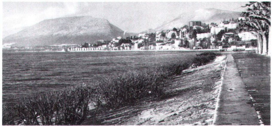
Les quais de Neuchâtel relient admirablement la ville et son lac. Et c'est ici que devait passer le tracé sud de la N 5!

svz. Témoin du riche passé valaisan, un musée d'archéologie s'est ouvert à Sion. On y admire des trouvailles romaines, principalement de Martigny (Octodurus), de mystérieuses stèles de pierre de l'époque néolithique, ainsi qu'une collection d'objets de verre presque unique au monde. Cette superbe collection, due à Edouard Guigoz , industriel de Chiasso et citoyen valaisan, comprend 3500 pièces: statues, cruches et lampes égyptiennes, mycéniennes, grecques et romaines. Ce musée a été aménagé dans les anciennes granges des princes-évêques de Sion (Grange à l'Evêque), près du château de la Majorie. Heures d'ouverture: tous les jours, sauf le lundi, de 9 à 12 h. et de 14 à 17 h.