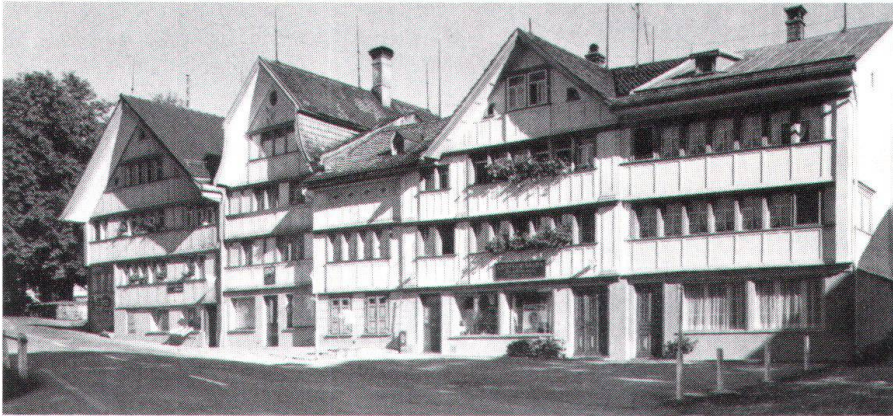
Gais hat an Architektur eben mehr als seinen legendären Dorfplatz zu bieten.