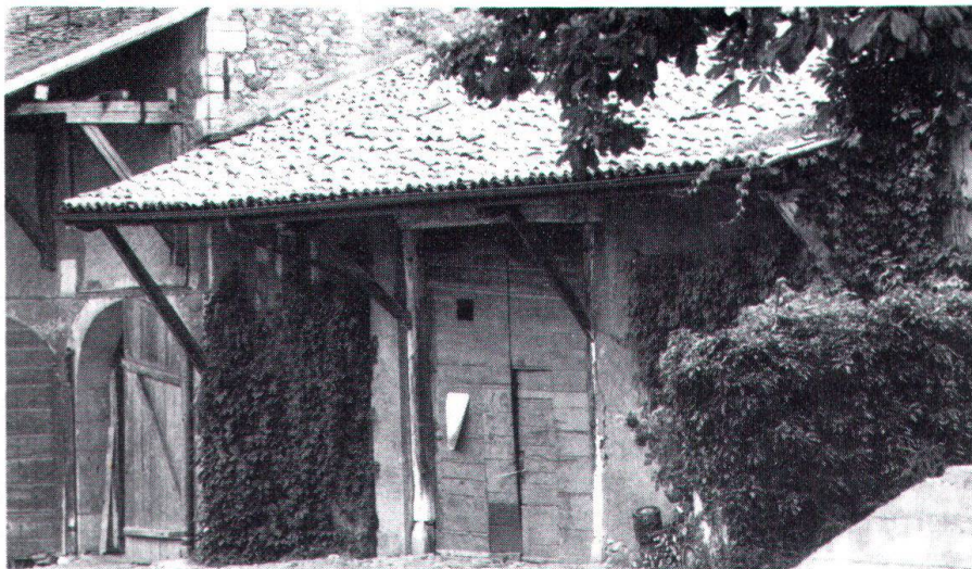
Village de Landecy. La maison rurale genevoise possède des caractéristiques pour une part mises en évidence par les relevés effectués en 1922/23 par P. Aubert.

(Petit-Sionnet, Les Mévaux), Lancy , Landecy , Sezegnin , Vernier , Versoix . D'autres villages ou sites urbains sont en cours de recensement: le Vieux-Carouge, la Corrairie, le quai des Bergues, le hameau de Chamlong (près de Chaney). En ville, ce recensement est déjà achevé en ce qui concerne le quartier place Grenus, rue des Étuves.