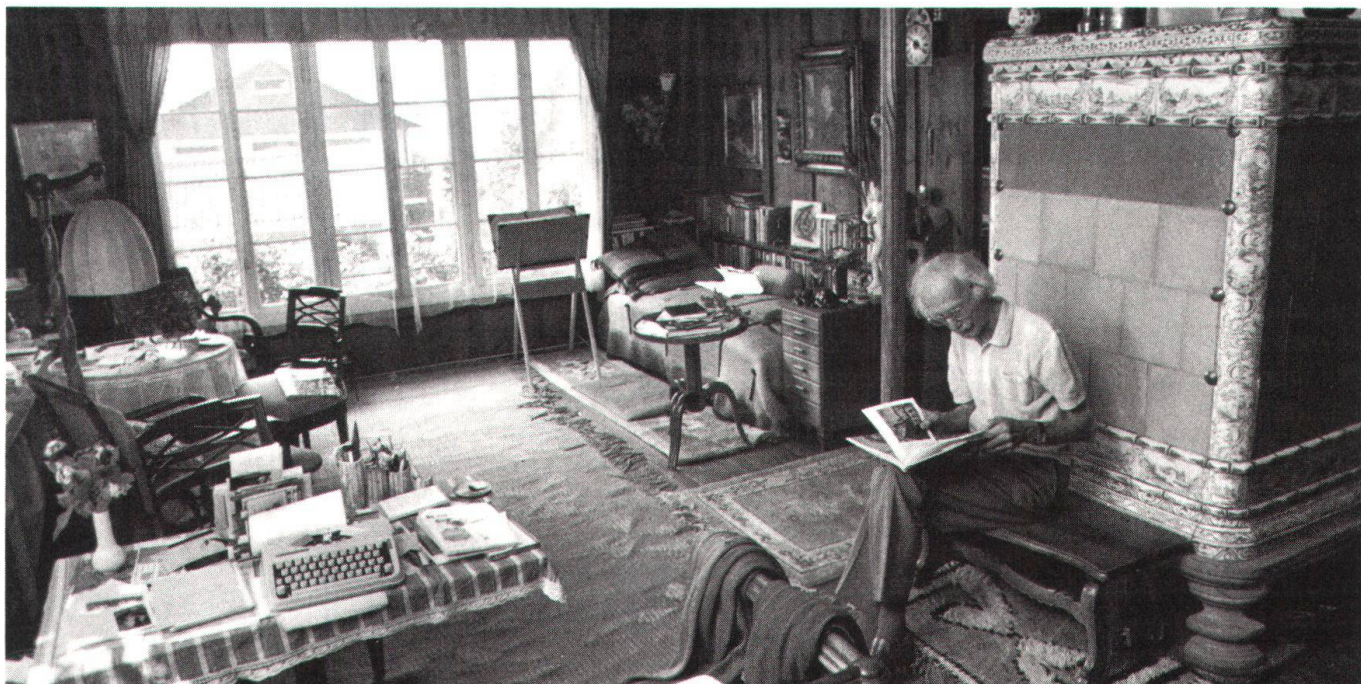
L'artiste qui quitte le «service de l'Ecu d'or» dans sa maison de Herrliberg.