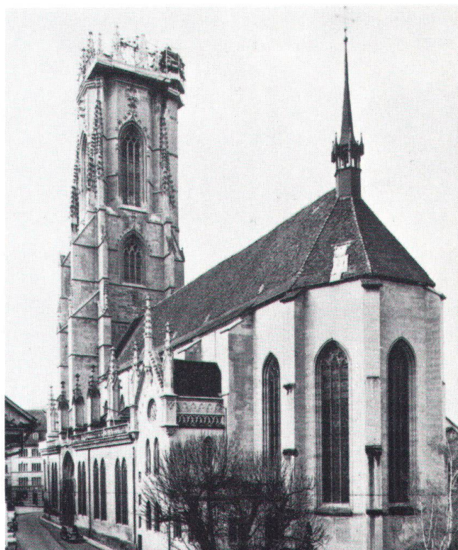
Cathédrale Saint-Nicolas de Fribourg (photo: section des monuments historiques du canton de Fribourg).

Restaurer une cathédrale ne signifie pas simplement remplacer les pierres en mauvais état par des pierres nouvelles. Ce type de travail débute nécessairement par une connaissance approfondie de l'histoire de l'édifice, de ses périodes de construction, de ses restaurations précédentes. Nous allons examiner succinctement les particularités, de ce point de vue, des travaux de conservation entrepris pour les cathédrales de Fribourg, Lausanne et Genève . Si Genève et Lausanne étaient au XIII e siècle des sièges épiscopaux, Fribourg n'avait alors qu'une église paroissiale de la ville. Les