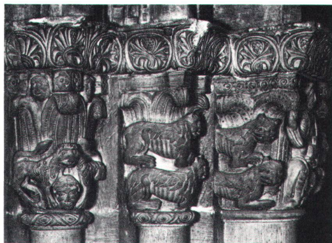
Cathédrale Saint-Pierre de Genève, chapiteaux intérieurs.