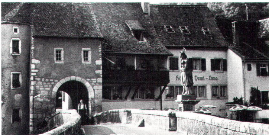
La porte St-Jean, avec le pont sur le Doubs de 1728 qu'orne la statue de saint Népomucène.

Saint-Ursanne est un site d'importance nationale. Ce qui implique de la part de la Commune de strictes limitations en matière de construction. La planification locale est achevée; le plan de zones a été ratifié unanimement, en octobre 1978, par l'assemblée de commune. Le règlement de construction protège efficacement l'ensemble de la vieille ville, par un article d'ordre général, et règle aussi la transformation des maisons existantes, ainsi que l'aspect des constructions nouvelles, jusque dans les détails (fenêtres, portes, crépis, coloris, etc.). Les environs immédiats de la zone centrale sont, aujourd'hui déjà, lotis en partie. Mais, dans le cadre de prescriptions sévères (intervention d'experts, obligation de présenter des maquettes, etc.), ils ne pourront être construits qu'avec des maisons ou des ateliers de deux étages au maximum. D'autres prescriptions protègent les deux rives du Doubs contre toute atteinte, définissent les périmètres du site et des plans d'eau à protéger, et contribuent également à préserver l'unité et le cachet historique du lieu.