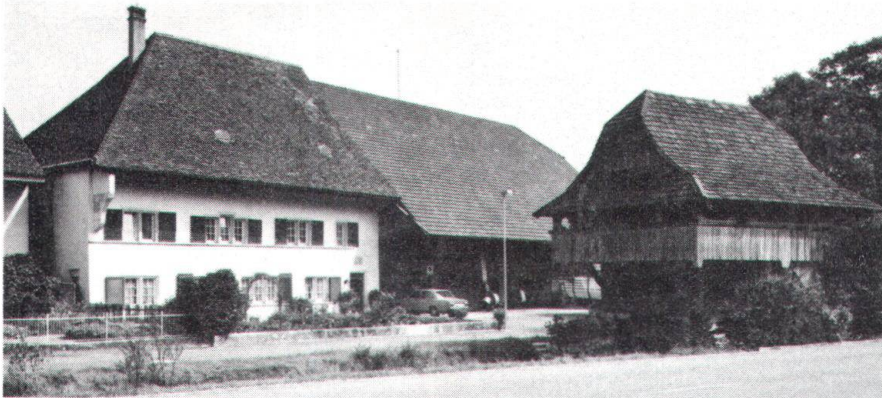
Untervogtshaus und Speicher Ramseyer in Neuendorf: vor einer gesicherten Zukunft? (Bild Jaeggi).

ton und der Gemeinderat für die Gemeinde das Mittel der Schutzverfügung , mit dem die Behörden im Einzelfall namentlich Bau-