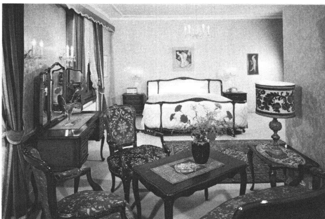
Hinter dem Riegel des Hotels «Krone» in Gottlieben TG verbirgt sich ein wahrer Schatz kunstvoller Innenausstattung. Oben ein Luxuszimmer im Louis-XV-Stil, unten eine Aussenansicht des unter grossen Opfern des Besitzers vollständig renovierten Gebäudes. (Archivbilder)