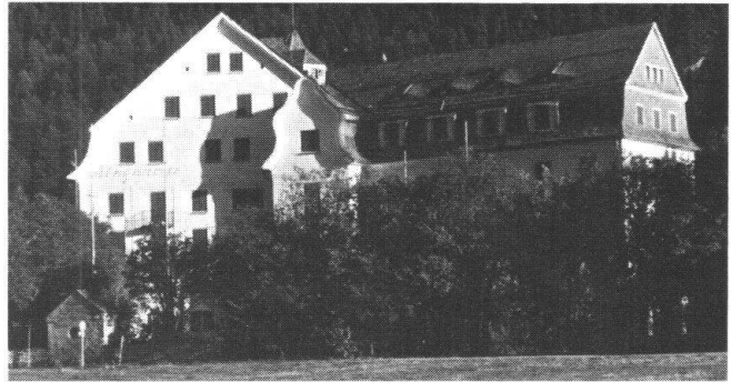
Zu den traditionsreichsten Oberengadiner Hotels gehört die «Alpenrose» in Sils. Seit mehreren Jahren ist es geschlossen und zerfällt zusehends, so dass schliesslich nichts anderes übrigbleiben wird, als es abzurechnen. Dreimal darf man raten, was dann an seine Stelle kommen wird!

Mit dem Verbot des Verkaufes von Grundeigentum an Ausländer haben die Gemeinden Sils , Silvaplana , St. Moritz , Pontresina , Celerina , Same-dan (dort ist eine Initiative eingereicht, deren Erfolg kaum zu bezweifeln ist), Bever , La Punt-Chamues-ch versucht, die Spekulation einzudämmen. Dass eine gewisse Beruhigung eintreten wird, ist gewiss. Zusätzlich haben einige Gemeinden Bausperren erlassen und sind jetzt daran, ihre Baugesetze zu verschärfen. Die Nachfrage geht