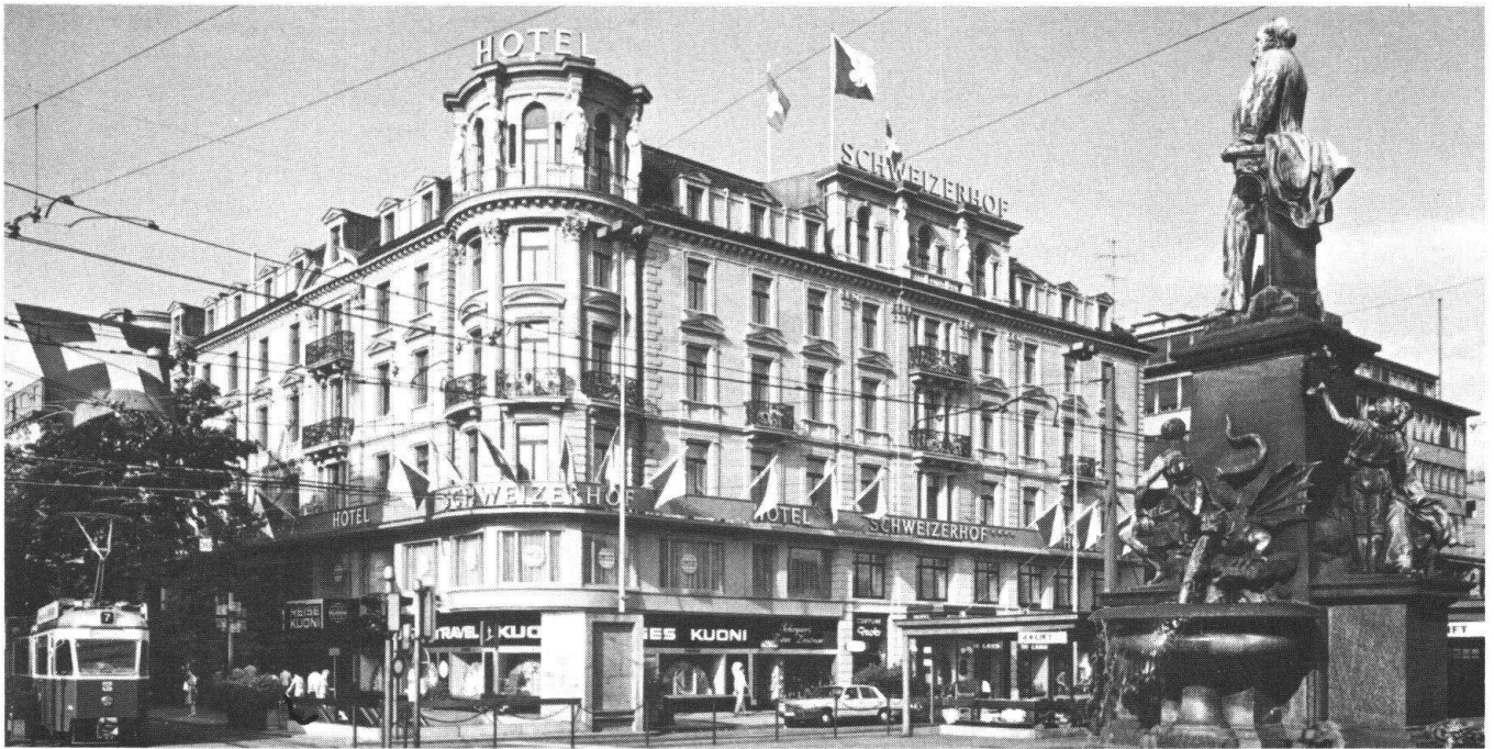
Nur noch teilweise seinem ursprünglichen Zweck dient der «Schweizerhof» in Zürich. Erdgeschoss und erster Stock beherbergen heute Geschäfte und Büros, wodurch viel von der einst prächtigen klassizistischen Fassade verlorengegangen ist. (Archivbild)