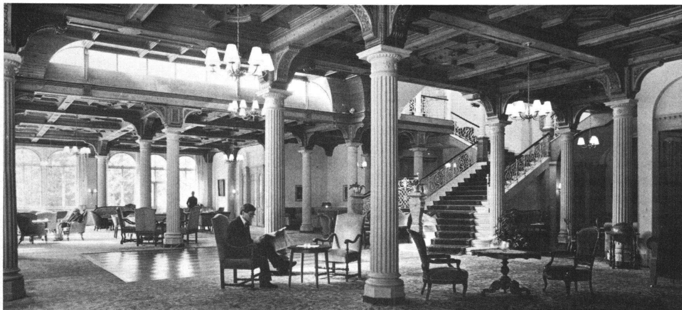
Die unvergleichliche Stimmung in alten Hotels, wie hier im «Waldhaus» Vulpera – wird sie bald dem weltweiten Uniformismus geopfert werden und der Geschichte angehören?

Zwischen Tradition, Heimatschutz und Betriebswirtschaft