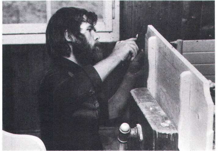
Hilfe zur Selbsthilfe ist das wichtigste Ziel: ein Tisch entsteht

«Die Kurse stehen in erster Linie Bauernleuten aus Berg und Tal offen.» Warum diese Beschränkung? Die schweizerische Landwirtschaft – und insbesondere die Berglandwirtschaft – befindet sich seit langer Zeit in einer Krise. Eine Änderung der Lage zeichnet sich nicht ab. Kostspielige Renovationsarbeiten an Bauernhäusern drängen sich jedoch mancherorts auf – aber für die Ausführung der Arbeiten durch das Gewerbe fehlt oft das Geld. Um in dieser Situation zu helfen, führt die Hei-