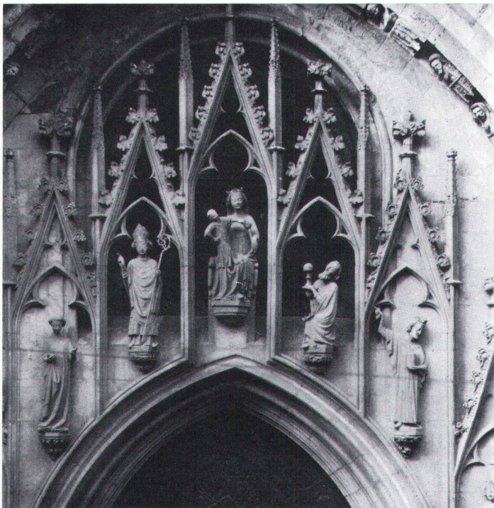
Ouvrage de graveur sur pierre à la cathédrale de Fribourg: fragment du portail sud.

Ähnliches ist auch bei den Holzverarbeitenden Berufen festzustellen, wo immer weniger mit regionalspezifischen Holzsorten und Techniken und immer mehr mit normierten Elementen gearbeitet wird. – Etwas besser liegen die Dinge beispielsweise bei den Gemälderestauratoren, Stukkateuren, Schmieden und ähnlichen Berufen, doch wirkt sich ihre Tätigkeit nur in beschränktem Masse auf unser bauliches Erbe aus. Schliesslich ist zu bedenken, dass die Bewahrung einer hochentwickelten Handwerkerkunst auch stark abhängt von der wirtschaftlichen Lage. Überleben wird sie nur, wo regelmässig Aufträge eingehen. Der damit zusammenhängende Konkurrenzkampf verführt nicht selten zu unersetzten Angeboten, die qualitativ nicht unbedingt halten, was sie versprechen.