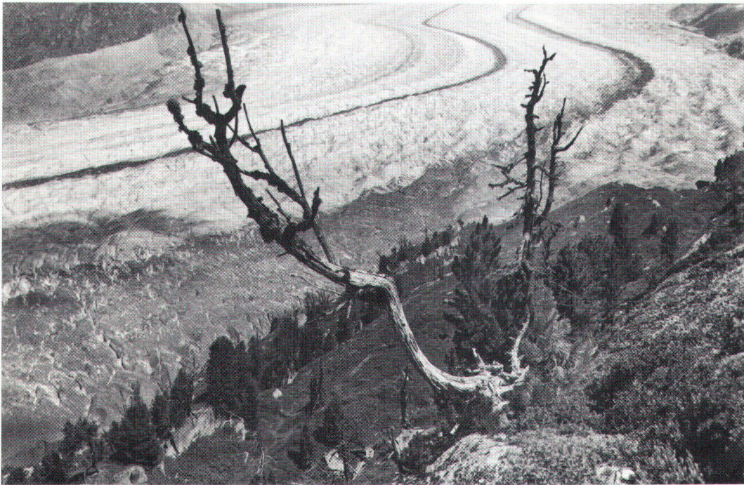
Im Aletschwald, einem der bedeutendsten Naturschutzgebiete des SBN Dans la forêt d'Aletsch, une des plus importantes réserves de la LSPN.