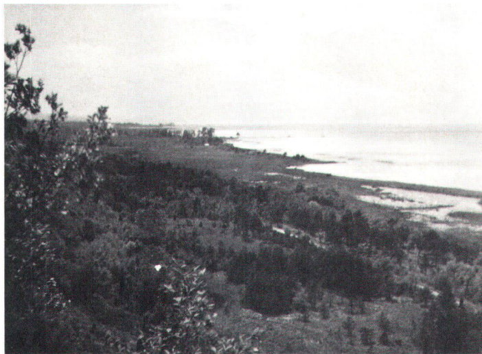
Naturufer des Neuenburgersees zwischen Portalban und Chevroux

Bald nach dem Krieg gelang es dem SBN, einen Wunsch von Paul Sarasin zu verwirklichen. Die vom SBN 1946 und 1947 nach Brunnen eingeladenen prominenten Naturschützer aus aller Welt bereiteten die 1948 in Paris erfolgte Gründung der Internationalen Naturschutzunion (IUCN) vor. Ihr Sitz befindet sich seit 1961 in der Schweiz. Beim Kampf gegen den übermässigen Ausbau der Wasserkraft zeigte sich die Schwäche der aus der Gründerzeit stammenden Struktur des SBN. Es fehlte