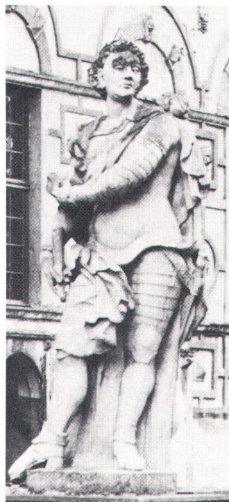
Innert 50 Jahren durch Umwelteinflüsse «das Gesicht verloren»: Gartenskulptur des 18. Jahrhunderts im Schloss Overhagen Au château d'Overhagen, statue du XVIII e siècle rongée par la pollution de l'air.

Denn obwohl mit dem baulichen Erbe heute viel behutsamer umgegangen wird, sind die Denkmäler doch keineswegs endgültig gerettet. Sie sind heute nur anderen Gefah-