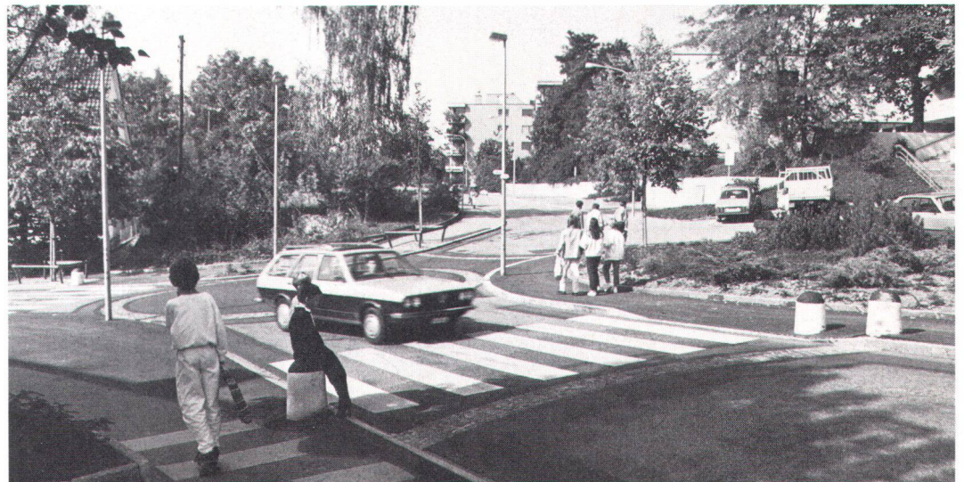
Bodenschwellen – hier im Zentrum von Oberengstringen ZH – zwingen zu langsamerer Fahrt und mehr Rücksicht auf den Fussgänger.

– Die Bevölkerung will wissen, dass z.B. die Langsam-