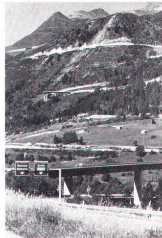
Gute Strassen minimalisieren die Eingriffe (links Tremola), schlechte aber maximalisieren sie (rechts Gotthard bei Airolo).

Les routes bien faites atténuent les atteintes au site (à g. Tremola), les mal faites les aggravent (à dr. l'autoroute près d'Airolo).