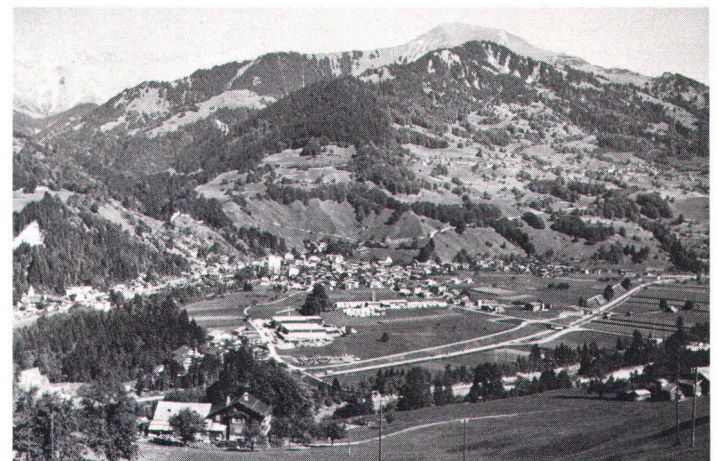
Umfahrungsstrassen müssen sich der Landschaft anpassen und nicht umgekehrt (im Bild Grüşch GR).

auch bei uns auf verschiedenen Ebenen entwickelt worden. Doch hinter diesen Normensammlungen steckt zuweilen ein beträchtliches Gefahrenpotential. Denn sie verleiten häufig zu einem Schematismus , der mit den Gegebenheiten einer natürlichen Landschaft schlichtweg unverein-