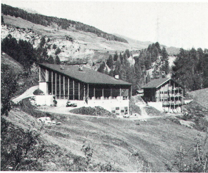
Landwirtschaftsbetrieb «Tanterdossa» bei Scuol GR (Architekt Bulolf Vital, Ebertswil) in Getrenntbauweise. Bâtiment agricole séparé, près de Scuol GR.

plus qu'une stagnation: un recul, un retour à une culture paysanne aujourd'hui dépouillée de son contenu et ne correspondant plus aux exigences de notre temps. Cela n'a rien à voir avec la «protection du patrimoine».