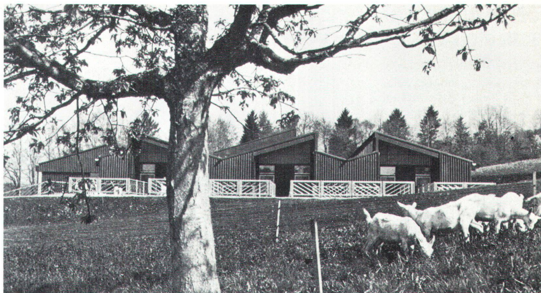
Landwirtschaftsbetrieb «Looren» in Wernetshausen ZH (Architekt Willi E. Christen, Zürich) mit Stall- und Ökonomiegebäude.

Diese neue «Pfad-Finderlösung» der Architektur, von USA-Architekt Sullivan um 1900 geprägt, machte sich ab 1960 unübersehbar im land-