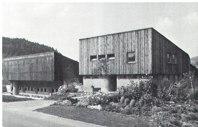
«Jonenhof» in Unterrifferswil ZH (Architekt Heinz Hess, Zürich), rechts Bauernwohnhaus, links Stallbau. «Jonenhaus» à Unterrifferswil ZH. A droite l'habitation, à gauche l'étable.

Der Verlust dieser Architektursprache setzte nach dem 1. Weltkrieg ein. Damals begann das Programm der Güterzusammenlegung (Melioration) anzulaufen. Gleichzeitig kam die Reform der traditionellen Agrarstruktur in Gang mit neuen, rationelleren Bewirtschaftungsmethoden und einer intensiven Mechanisierung. In Regionen mit Aussiedlung der Bauernhöfe aus den gewachsenen Dörfern in die freie Landschaft war das Thema der neuen Gestalt besonders akzentuiert gestellt. Aber auch in Gebieten wie beispielsweise dem Appenzell und dem Emmental mit ihren Streubauweisen und dem Eindachhof sind durch die neuen Betriebsanforderungen neue Haustypen notwendig geworden. Dabei haben die beiden